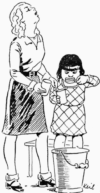
Puhastage hambaid ja suud!