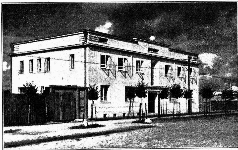
Rakvere Ühishaigekassa vastvalmisaanud maja lõuna-homniku poolt vaadatuna.

takse maal rahva tervishoiu tõstmiseks kõigepealt tihendada jaoskonnaarstide võrku