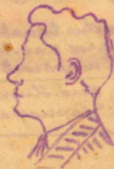
inces kellel alati midagi öelda on. oo