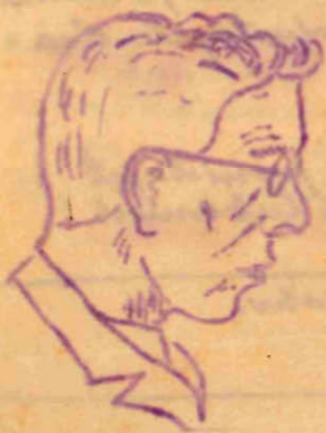
ägedam töö- venol „Kartsumdi“

„Kartsumdi“ hümn. „Kartsumdi! — lõhkel müin. Kongress läeb laiali — lavüin: „Kartsumdi! — maha vüin!“ — „Me värtlühõistk karmüin „Kartsumdi“ — vümmemüin.“