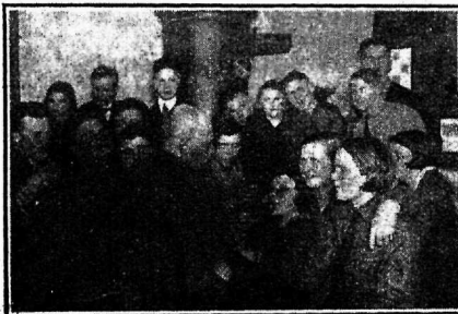
Kirjandusõhtu „Karl Marx'i“ ühingus.

Koosviibimine pärast esimest kongressipäeva.