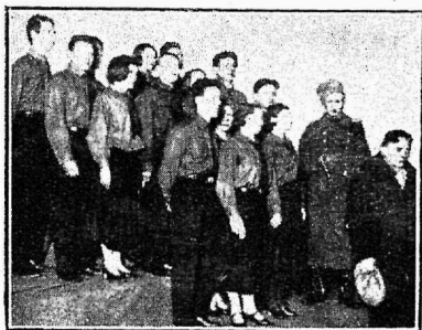
Kongressi kõnekoor (Revolutsiooni päha)

„Eesti Noorsotsialistliku Liidu VI kongress pöörduv tervitusega Soome vennasliidu poole, kes on praegugi veel ähvardava reaktsiooni pääletungide osaline. Meie teame, et tööliikumist ei saa täiesti suruda alla ükski reaktsiooni vorm, Soome visal töölisnoorpõlvel on jõudu võitluseks tööliisklassi, sotsialismi ja inimkonna eest.“