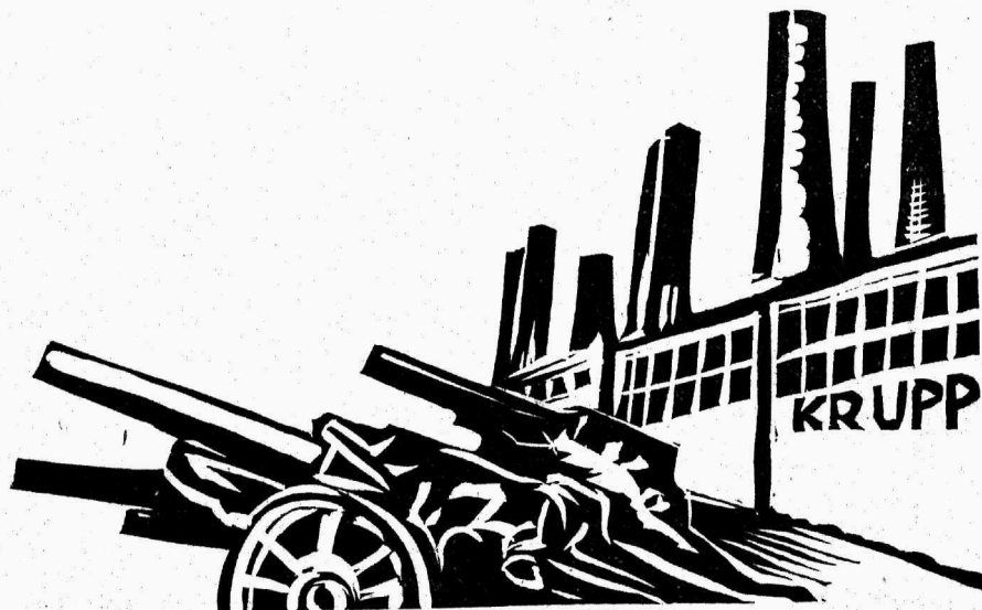
Relbastusvabrikud ähvardavad, Krupp Saksamaal, Schneider Prantsusmaal. Ei iial sõda!

Läind sajandil Marx'i surmast saidik marksism proletariaarsena võitluseõpetusena ja meelsusena oli oluliselt Saksa ja pääle selle kõige enam Vene nähe. Alles nüüd marksism hakkab haarama enam ja enam maailmaproletariaati. See tuleneb paratamatult praeguse kapitalismi lõpufaasi majanduslikust ja poliitilisest situatsioonist. Kui varem oleme näind, et kapitalismi kauakestvad soodsad konjunktuurid ikka on mõjustand proletariaarse klassivõitluse kõrvalekaldumisi marksismi joonelt, siis kapitalismi see periood on mööda. Väga õieti Otto Bauer Austria viimasel partei-