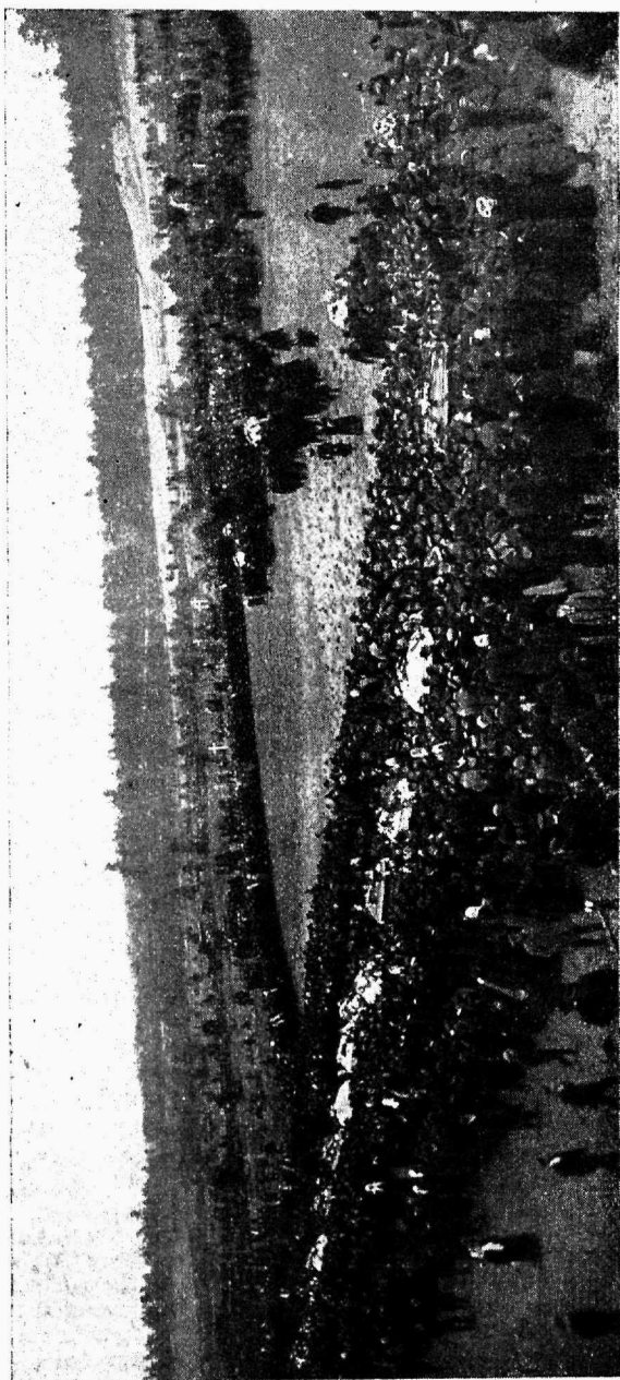
16. oktoobri õhuvite matmine Rahumäel