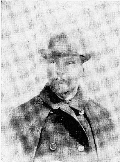
Mihkel Martna maalermeisterina.

Kuid Mihkel Martnat meie ei võdi hinnata ükfi kui tööliskumise tegelast ja poliitilist mõtlejat, vaid ka kui riigitegelast. Tema teos: „Estland, die Esten und die estnische Frage“, mis tõlgitud mitmesse keelde, tõendab ükfi tema küpset juhtumist meie rahwa ja riigi jaatusesse. Kuid meie võime ütelda veel enam: Eesti riigi rajamise silmapilgul olid Martna juhted Lääne-Euroopa riikide demokraatlikkude kihidega jeevõrd juured, et ka meie, muidu nii pentsi-kult tööliskumisse juhtuvad kodanlijed kihid pidid nikutama oma põlvi Martna ees, et ühes temaga nõutada meie rahwa rippumatusje tunnustust. Siit on ka aru-jaadaw, et neil aegadel Mihkel Martnal ja ühes temaga fogu eesti jotsjalistlikul liikumisel oli mõju meie riigiforra kindlaksmääramisel. Meie põhjeadus poleks kujunenud laugelthi nii modern-demokraatlikuks, nagu ta on praegu, kui poleks mitte meie tööliskonna keskelt võrjunud Mihkel Martna ja temataolisi tööliskumise juhte.