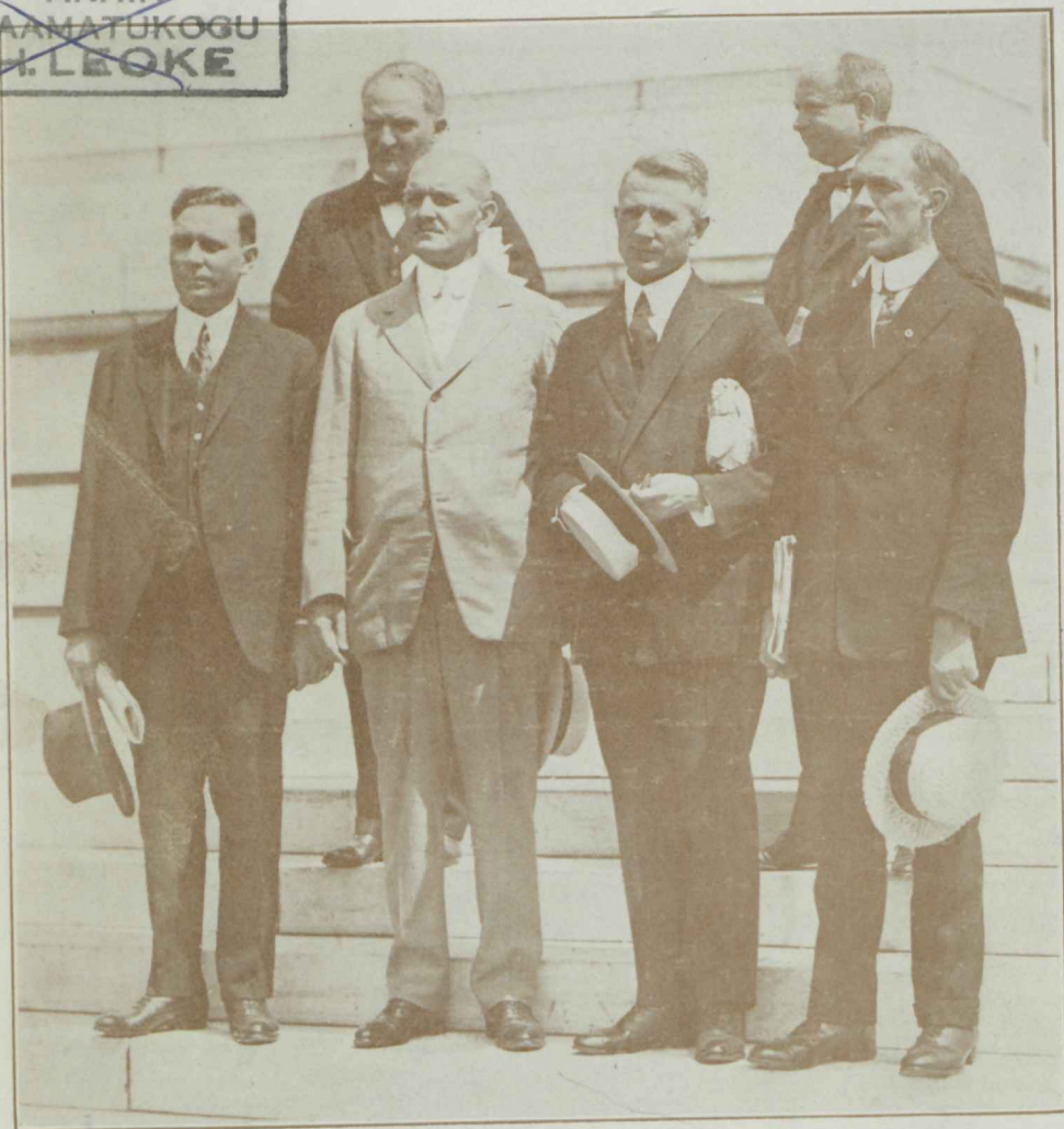
Nelja rahva ühisuse saadikud Washingtonis.