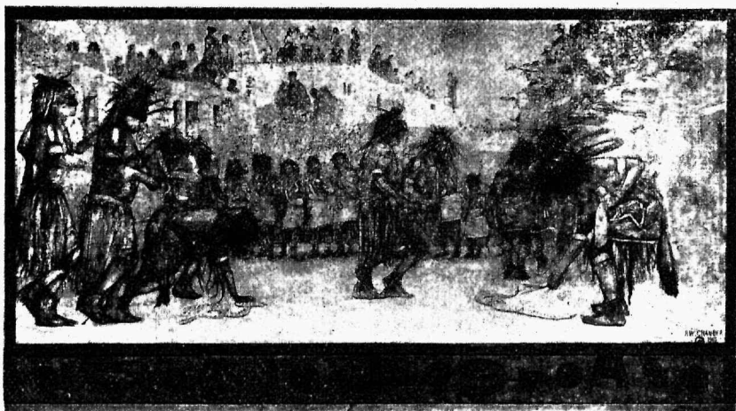
INDIANLASTE USSI TANTS.—Seina paneel.