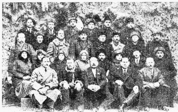
1905. a. Eesti tööliikumise tegelased nõupidamisel 16. jaanuaril 1926. a. Wiktor Kingissepa nimelises Haridusmajas Leningradis.