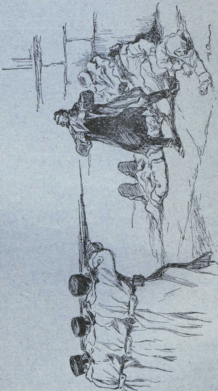
NEWSKI PROSPEKTIL 1905. AASTAL. — Joonistatud I. SIMAKOW.