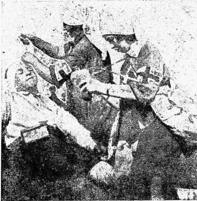
Esimene abiandmine haawatutele.

Nõukogude Punaseristi ühisus organiseeris Punaseristi ühisuste ja Punaste poolkuude liidu, mis ühendab 9 nõukogude Punaseristi ühisust ja Punast poolkuud, kellel on täidesaatekomitee üleilmse ulatuses. 1926. aasta Punaseristi Rahwuswaheline komitee tunnistas Nõukogude liidu Punaseristi ühisused ja Punast poolkuud kõikides wabariikides Punaseristi esitusteks.