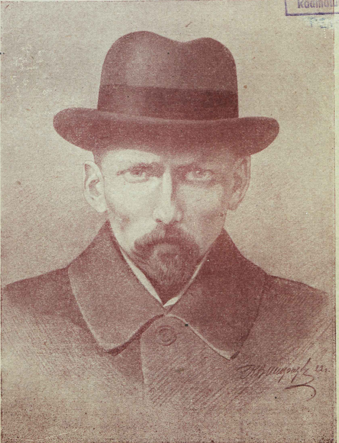
Sm. VIKTOR KINGISSEPP

Proletkult nim. Eesti NSV Riiklik Raamatukogu