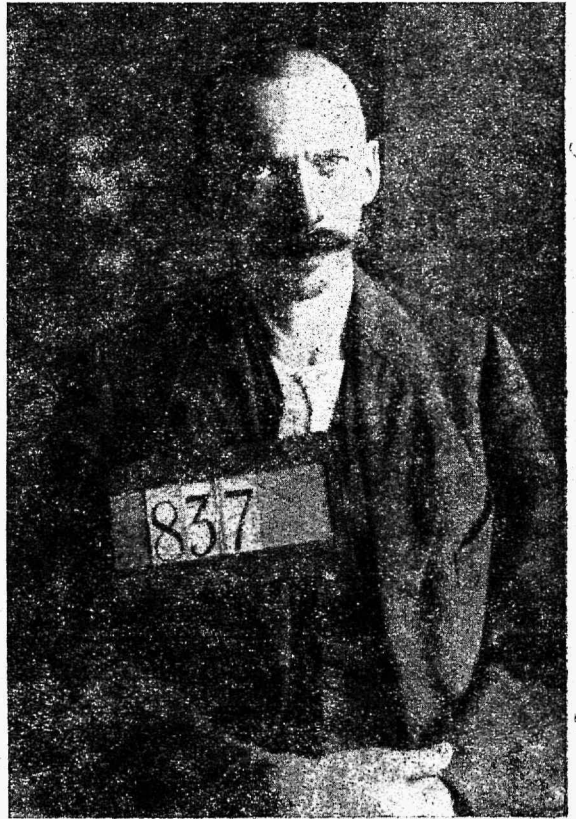
W. Kingissepp kaitsepolitseis enne tapmist.

Meie Nõukogude Liidus elawad eestlased, sm. Wiktor Kingissepa 10. aasta tapmise päewa mälestades, töötame weel kindlamalt wõidelda wiieaastaplaani 4 aastaga teostamise eest ja teise wiieaastaplaani teostamisele asuda.