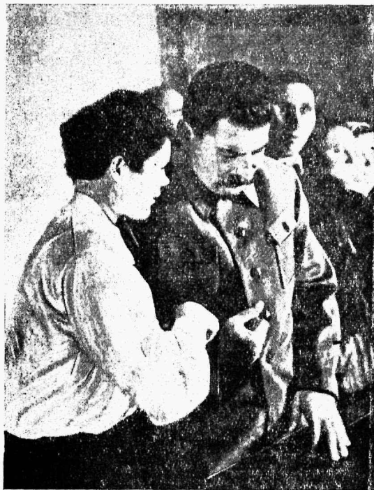
10. novembril oli suhkrupeedi väljade naiskolhoosnikkude-lööklaste vastuvõtt partei ja valitsuse juhtide poolt.

Ta ütles veel nii: — Viiskümmend kuus aastat elan ilmas, aga ma pole näinud niisuguseid kangelannasid, nagu teie.