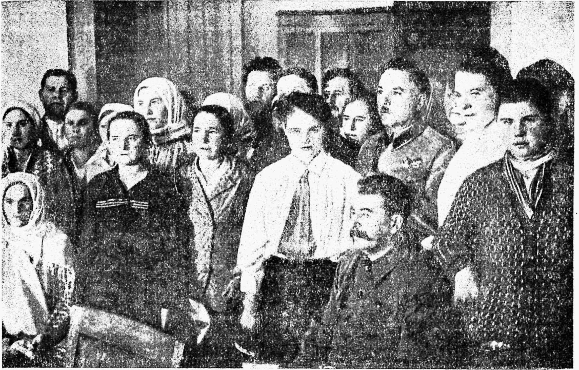
Sm. Stalin ja teised naiskolhoosnikkude hulgas.

täieõiguslikuks inimeseks ja kodanikuks. Kolhoosid tõmbasid naisterahva sotsialistlikule ehitustööle, nad avasid tema ees avara tee kultuuri kõrgustikkudele, kergendasid osavõttu riigi valitsemisest, lõpuks tegid kolhoosid võimalikuks naisterahva muutumise tõelikuks naiskangelaseks, löid talle kogu töörahva au ja austuse.