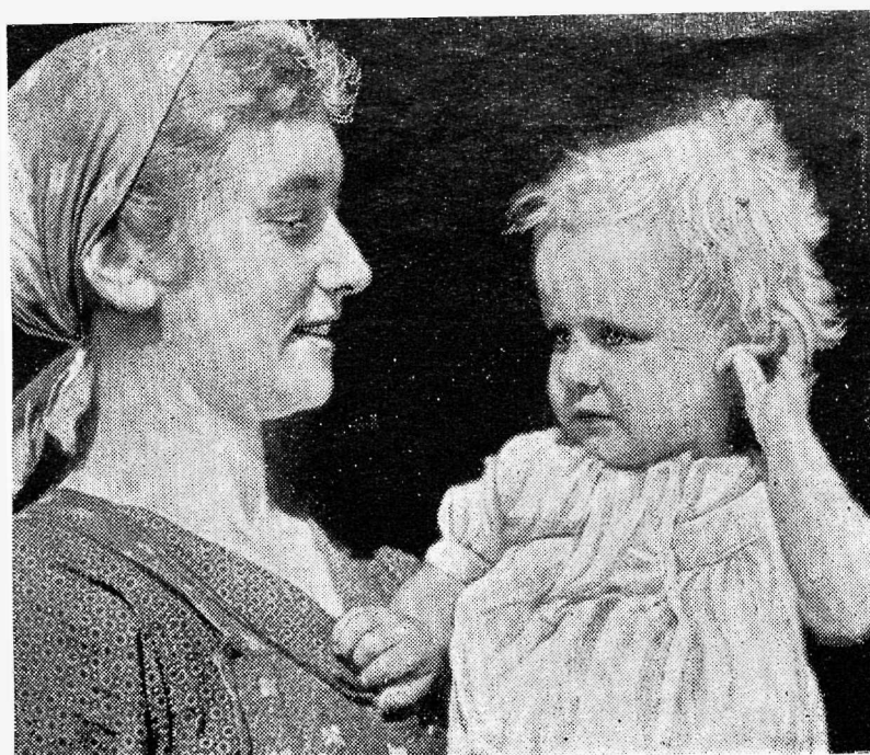
Emal kallim vara.

Samuti on olnud lugu minevikus. Kõigele muule aga veel juurde lisades sõjakoledusi, katku jne.!