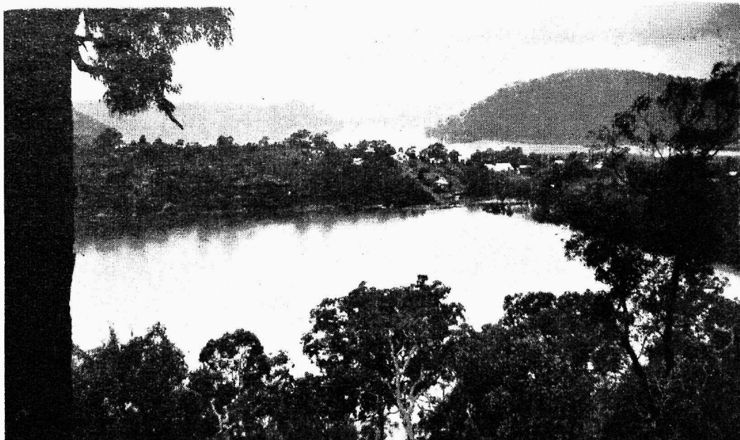
Luuleline Austraalia maastik. Hawkesbury jõgi New South Wales'is.

New Yorgis lehed alatasa toovad kõmutateid haide ilmumisest New Yorgi sadama vetesse, aga kui kord üks rahamees avalikult teatas, et ta annab 500 dollarit esimese, täiesti kindlaks tehtud juhtumi eest, mil hai mõnd newjorklast on kimbutanud, siis jäi see raha temal siiski välja andmata. Need meresügavuste gangsterid aga tegid suplemise Austraalia rannavetes niivõrd ohtlikuks, et valitsus palkas 20.000 naela eest kõik Austraalia suurima kalameesteühingu liikmed haidejahile Austraalia vetes. Tulemusena suplemine mererannas ongi juba muutunud rohkem ohutuks, ja kahjutuks tehtud „meretiigrite“ nahast valmistatakse häid naiste kingi ja käekotte. Hai liha sulatatakse õliks, soomused aga eksporditakse Hiinasse, kus elanikud neid tarvitavad maiusroana.