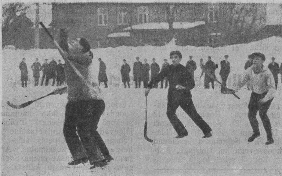
Moment võistlustest V. S. „Sport“ ja Narva „Kalevi“ vahel.