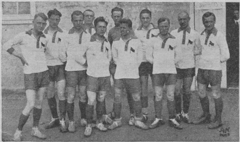
Leedu rahvusmeeskond jalgpallis,