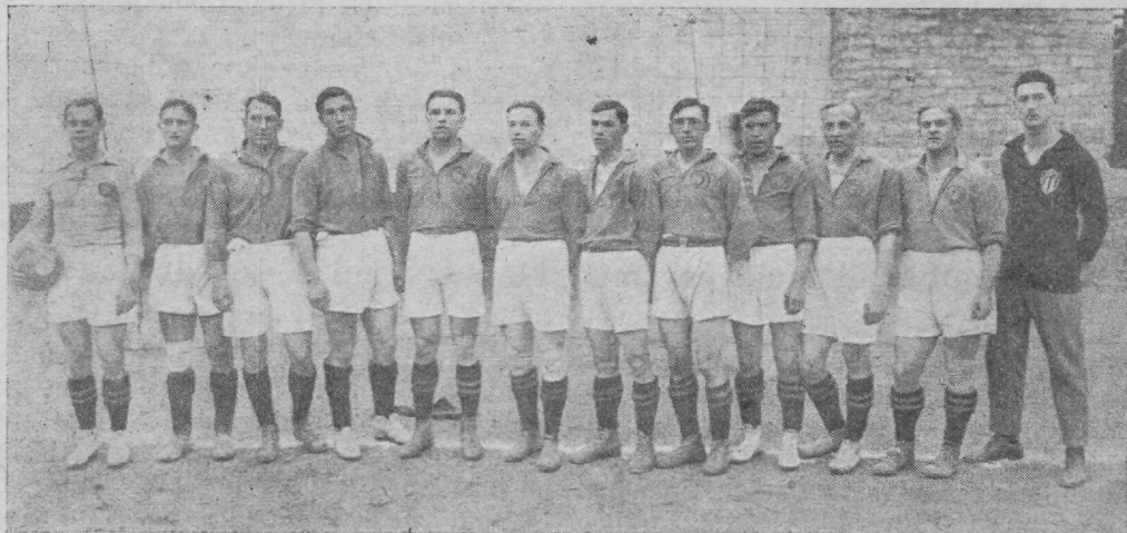
Vene esitusmeeskond jalgpallis,

Mis meestesse ja otsekohe nende väli- musesse puutub, siis on see kirju, nagu pealinna päevalehed ka juba märkisid. Kuid igal juhusel ei ole olukord nii hull, nagu seda „Vaba Maa“ märkinud. Viima- ne teatas, et ühelgi mehel ei olla kraet (!)