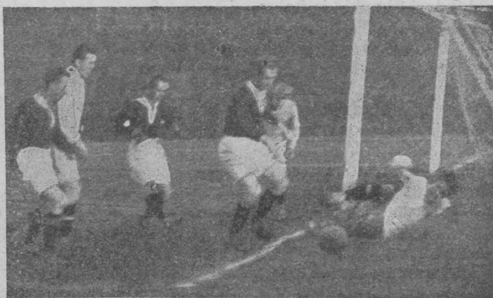
1. Läti—Eesti maavõistlus Riias 1922 a.:

Kardetav moment Eesti väravas. Juba outi läinud palli juures maas on Javorski.