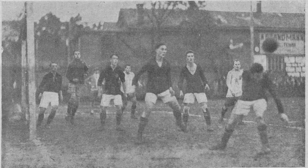
Kalev-Spordi võistluselt: Nurgalöögi moment Kalevi värava all.