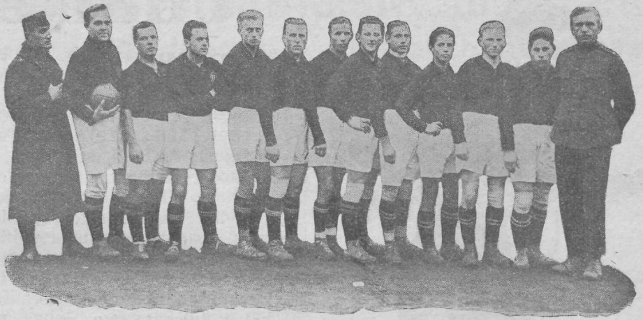
Kolm aastat järjestikku Eesti 2. kl. jalgpalli meister.

Tall. Kalevi meeskond, kes 1922., 1923. ja 1924. a. omanud Eesti 2. kl. jalgpallimeistri tiitli.