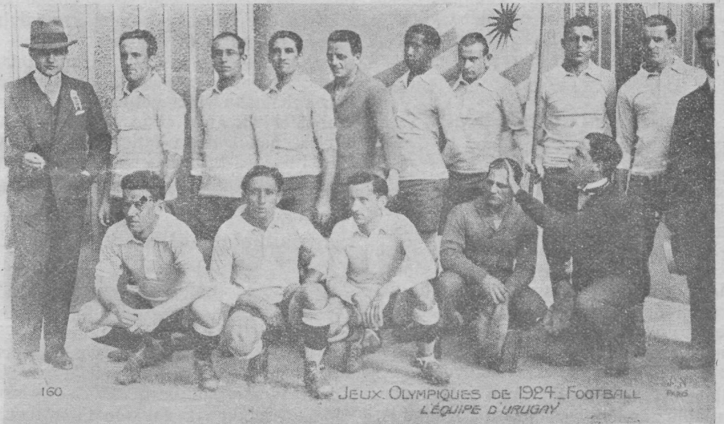
Uruguai olümpia meeskond,

Argentiina ja Uruguai, pampasside ja savannide tuline tõug, sugulane üksteisega vere poolest, Romaani algupäraga. Terve kuid muutlik kliima sagedate äikesetormidega, põliste laante ja lagendikudega, mägedega, kus rauda, tina, kulda, hõbedat. Maa päriselanikud charruasid ja muud suhuharud olid vahva tõug, langeid kuni viimasteni sissetungivate hispaanlaste ja itaallaste ees ja praegu püüab neist ainult mälestus ja leitakse nende vanu sõjakirveid ja odaotsi La-Plata liivastelt kallastelt. 18. aastasajal hakati sisse vedama sinna neegreid, kuid neil ei olnud pikka aega nad langesid liigjoomise, tiisikuse ja pidalitõve ohvriks, mille tõttu nende sugu seal väljasures on. Andrade oli Uruguai meeskonnas siiski tsiviliseerunud neegritõu suurejooneline edustaja ja löikas Pariisi jalgpalliturniiril