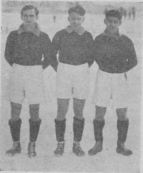
Kolenaty, Kada, Cerveny, kolm Praha ilmakulsat jalgpallimeest ja Tshehi rahvusmeeskonna peatuge.