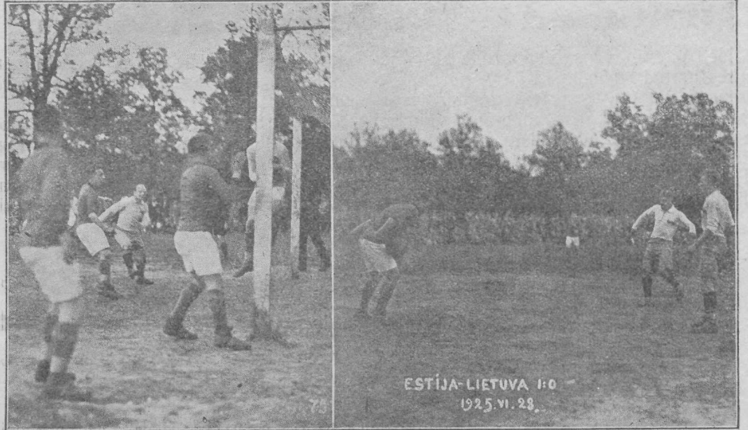
Kaks tunnustamata jäänud väravat Eesti-Leedu maavõistlusel.

ei vasta hästi mängu käigule. Leedulastel oli esimesel poolajal kaks kõige paremat shanssi, meil selle vastu peale otsekohe kaduma läinud kahe värava veel 3—4 head võimalust. Nii väravavõimalusi kui ka üldist jõudude vahekorda arvestades oleks tagajärg 3:1 või 4:1 meie võiduks õigemalt iseloomustanud jõudude vahekorda.