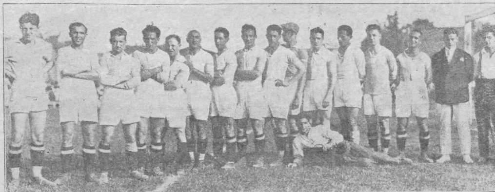
Austria meistermeeskond Viini Hakoah.

— Kalev 3 võitis 9. aug. oma väljal Võitleja reservmeeskonda 4:0 (1:0). Mängu tuli katkes-