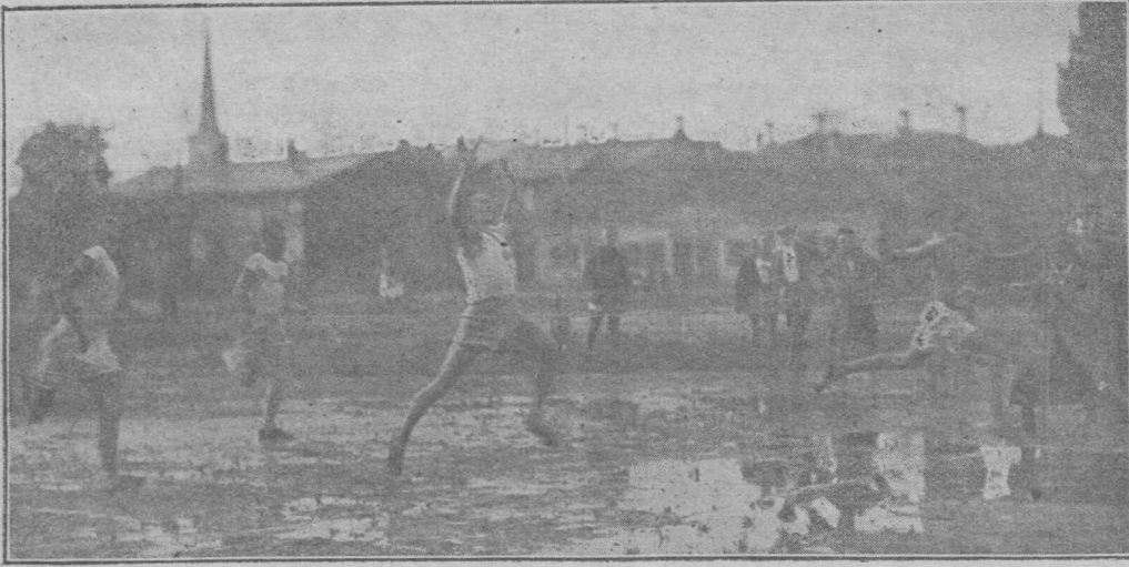
100 mtr. finish esivõistlustel. Paremalt võitja Keskiüll, edasi Laabent, Viin ja Kitsing.