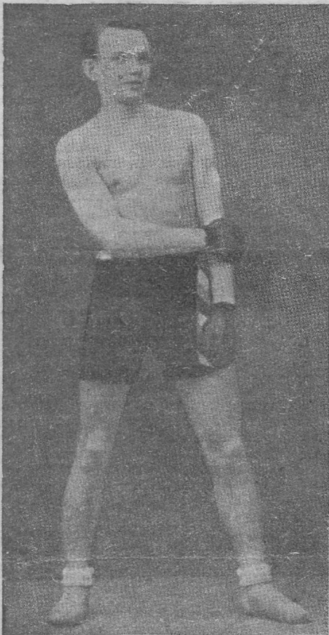
Palm, parim mees eestlastest.

Kahe kaotatud pallivõistluse vahel oli poksimavõistlus soojakskütvaks lohutuseks.