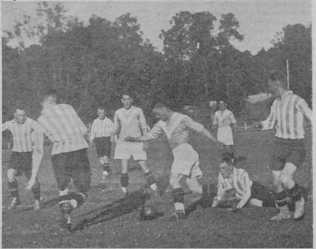
Hertha vasaksisemine Cisar tantsib palliga Viini valssi Spordi mängijate keskel.

Teine poolaeg töötas erutavat ja see ei jäänud tulemata. Esimese matschi järele kinnitasid viinlased, et neil korda ei olnud läinud näidata oma pallikunsti, ku-