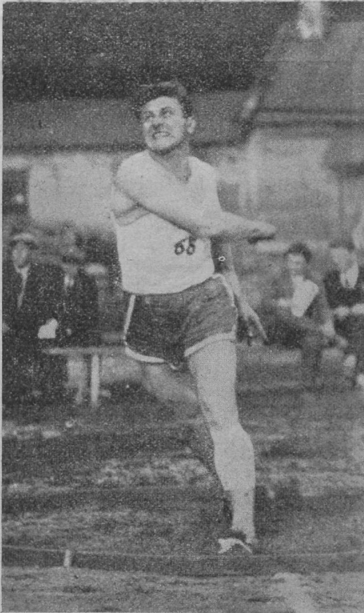
E. esivõistlustelt: Kalkun heidab uue kettarekordi 44.80.

Esivõistlused on läbi ja kohtunikkuude kolleegium hingab kergendatult. Peab kohe märkima, et tartlased nende võistluste korraldamisega suure töö ja väga rahuldavalt ära tegid. Keskmiselt 10½ tunniga 31 ala läbi viia liiti massilise osavõtu juures ja pealegi kitsal väljal on pandiks, et korralduse suhtes peagi Tallinnale järele jõutakse. Ei tahaks aga kunagi soovitada nais- ja meesvõistluste üheaegset pidamist sellisel piiratud väljal, olgu see vaid Tallinna staadionil läbiviidav. Publikut oli palavuse ja väljasõitude peale vaatamata kaunis arvukalt, püüdes kannatlikult lõpuni paigal. Auhindu jagati meistritele (võõrastav, et midagi neisse polnud graveeritud), teisele ja kolmandale kohale tulijatele annetati diplomid, koguhindadeks olid pronkskujukesed.