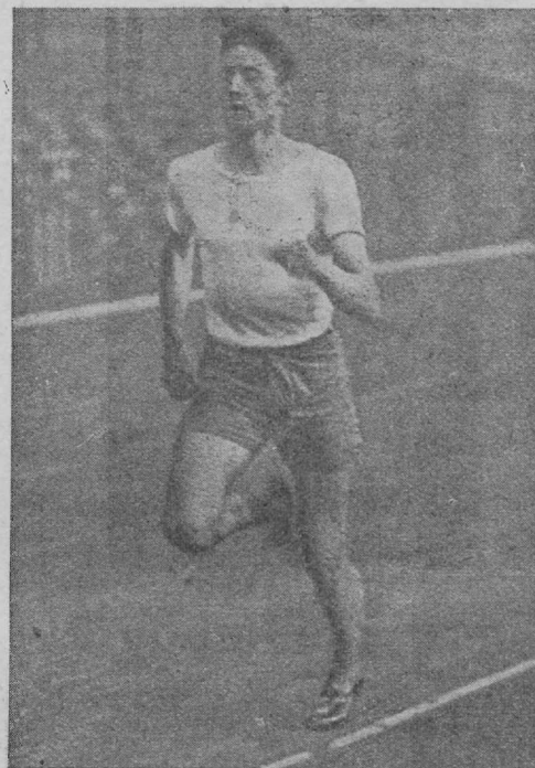
Sera Martin, vastne maailma rekordimees 800 meetris ajaga 1.50,6.

Kõrged tagajärjed jätkusid ka teistel aladel: kaugus Köchermann 745,5, teine Meyer 738, kolmas Scheck 701; teivas Möller 382; kõrgus Bonneder 190,5, 2) Huhn 188,5, 3) Rosenthal 188,5. Kuuli tõukas Hirschfeld 15,46, 2) Uebler 14,66, 3) Kulzer 14,16. Oda — 1) Schlokat 62,34, 2) Stoschek 62,23, 3) Macke 61,50. Vasarat heitis Wenninger 43,74.