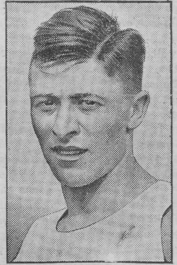
Sakslane Dobermann, kes on hea kuulitõukaja, läheb Brasiiliasse riigitreeneriks.

10.-võistlus: Weiss — 7536,70 punkti, Eberle — 7057,49 p., Voss — 6747,21 p.