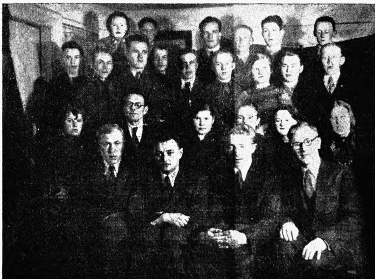
Noorte juhtide kursus Palal.

Kursuste lõpul peeti Kodavere-Alatskivi Maanoorte Ühenduse üldkoosolekut, kus vastuvõetud otsused töötavad tuua uut elevust maanoorte töös. Erilist tähelepanu pälvab ainulaadne ja omapärane üritus oskuvõimete arendamiseks korraldatav oskuvõimete viievõistlus. Võistlus toimub eeltuleval suvel ränd-