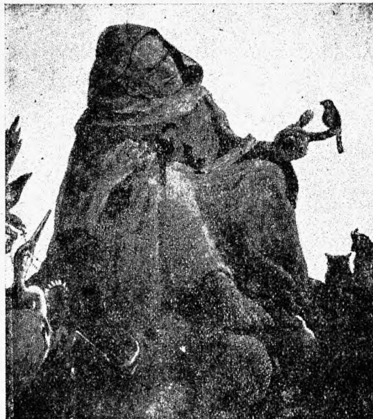
Püha Francesco jutlustab lindudel.

Itaalia keelest V. Grünthal. Ajak. „Noor-Eesti“ N. 5/6.