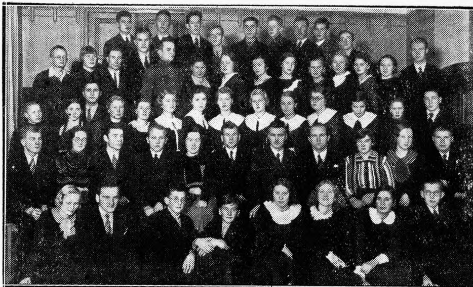
ENK 7. noorsootegelaste kursusest osavõtjad.

„Uustulnukail noorsooringide juhatusis on tihti palju hädad tahet, vaimustust ja energiat, kuid puuduvad teadmised, oskused ja kogemused ringi töö organiseerimiseks ja juhtimiseks. Noorsootegelaste instrueerimiseks, nende teadmiste süvendamiseks ja kogemuste rikastamiseks korraldabki Eesti Noorsoo Karskusliit iga 2 aasta järele noorsootegelaste kursusi.“ Nende lausetega algas kutse, milles Eesti Noorsoo Karskusliit palus noori osa võtma oma 7. noorsootegelaste kursusest. Ma leiain, et nende kahe lausega on väga tabavalt ja kokkuvõtlikult öeldud, missuguseid suuri ülesandeid taotlevad noorsootegelaste kursused ja kui suur tähtsus neil on meie karskustöös.