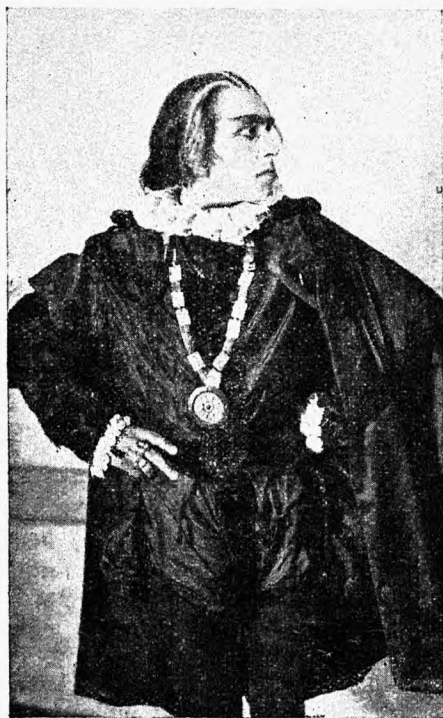
Igamees (A. Rütli).

Selle järele vaikisid mõlemad. Eit piilus, mis mõju need sõnad vanamehele avaldasid. Viimane aga näis täiesti rahulikuna, näol kivinend ilme,