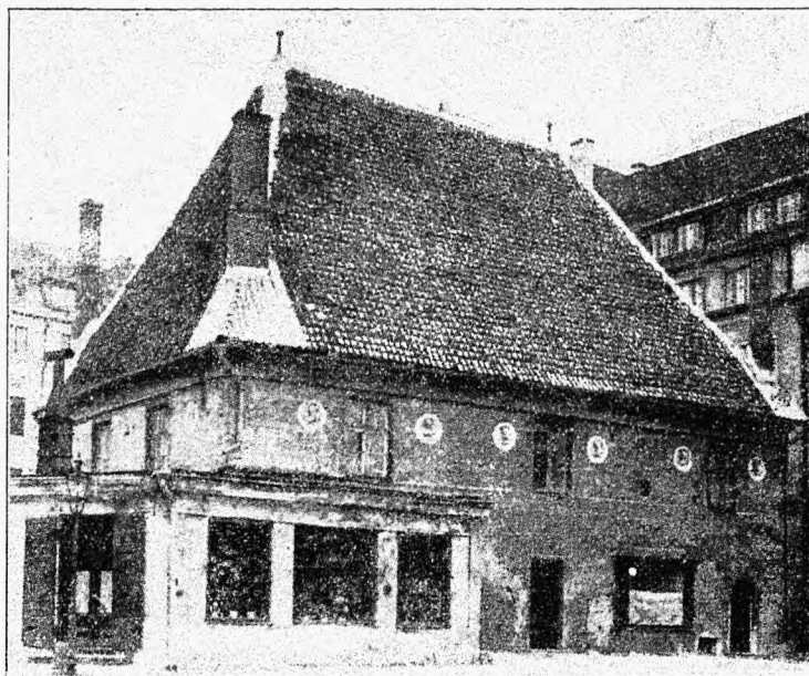
Tallinna vana vaekoda, mille teisel korral asub Rahvusliku Keskerakonna Keskbüroo. Uks märgitud X.

Riigikogu liikmete arv jääb küll endiseks, kuid kulud vähenevad, sest Riigikogu liikmetele maksetakse tasu ainuuksi istungjärkude kestusel, aastas kokku mitte üle 6 kuu. Riigikogu liikmete kvaliteedi tõstmiseks nõuab R. Keskerakond isikute valimist. Seega oleks alal hoitud Riigikogu töö võime, väikese liikmete arvu välise mõjutamise võimalused, aga kokkuhoides kulusid.