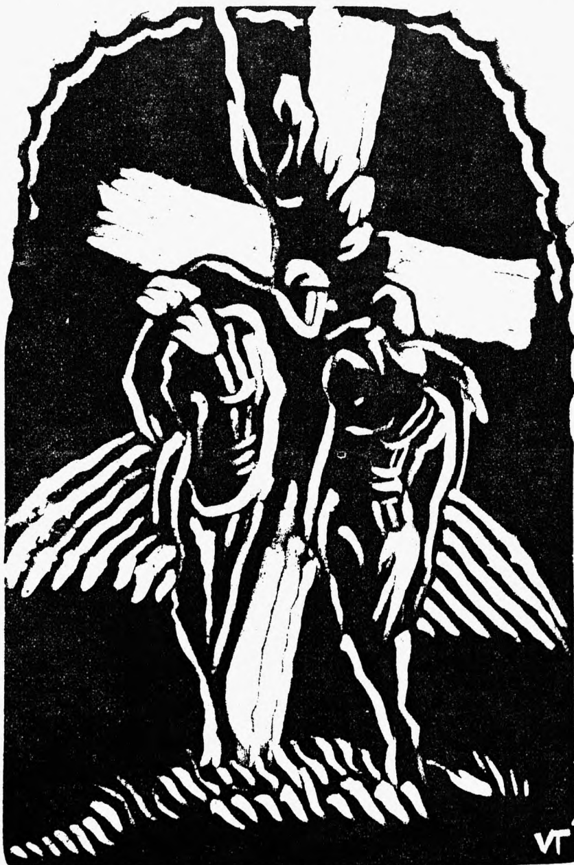
V. Turp'i linoleumlõige.

„kommunist“ ei ole veel kuigi oluline vahe (sest 99% vahest nende vahel niikuinii õieti aru ei saa!). Kuidas viimane