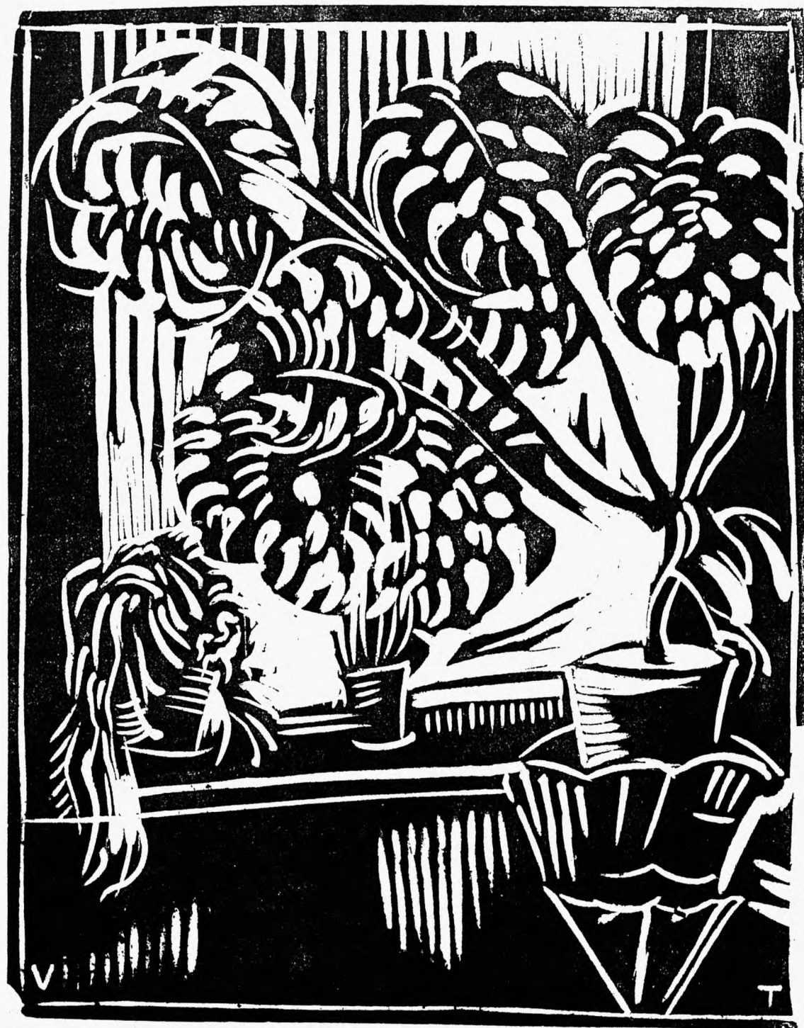
V. Turp'i linoleumlõige.