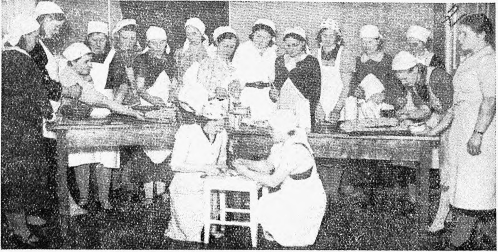
Toitluskursusest osavõtjad tööl Kuremaa riigimõisas, Tartumaal.

tööd. Ka puuduvad Kojal veel mõnes töö- liskeskuses (eriti uutes riigimõisades) usaldusmehed. Mõned suhtuvad oma üles- andesse ka loiult. Tihtigi kardavad aga usaldusmehed täita enda peale võetud üles- andeid, oletades pahatahtlikku suhtumist mõisavalitsuste poolt. Viimasel juhul on küll paljudes kohtades tegemist eksiarma- misega, sest õige peremees teab, et mida arenum on tööline ja mida paremini kor- rastatud tema kodune majapidamine, seda enam jätkub ka töölisnaisel aega välistöö- deks.