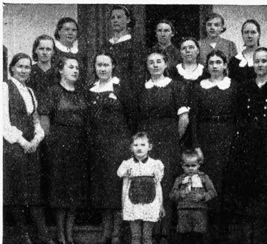
Koja poolt korraldatud käsitöökursusest osa- võtjaid Põlli mõisas

Villaseid vaipu, pesu, sukki, kindaid jne. on hea panna ka tihedasse ja hästisuletavasse puust kasti. Kasti võiks enne seest