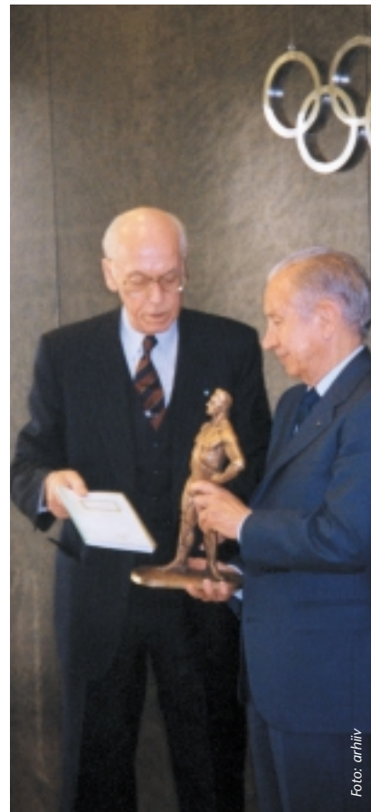
Kaks tänavu ametist lahkuvat presidenti: Lennart Meri ja Juan Antonio Samaranch.