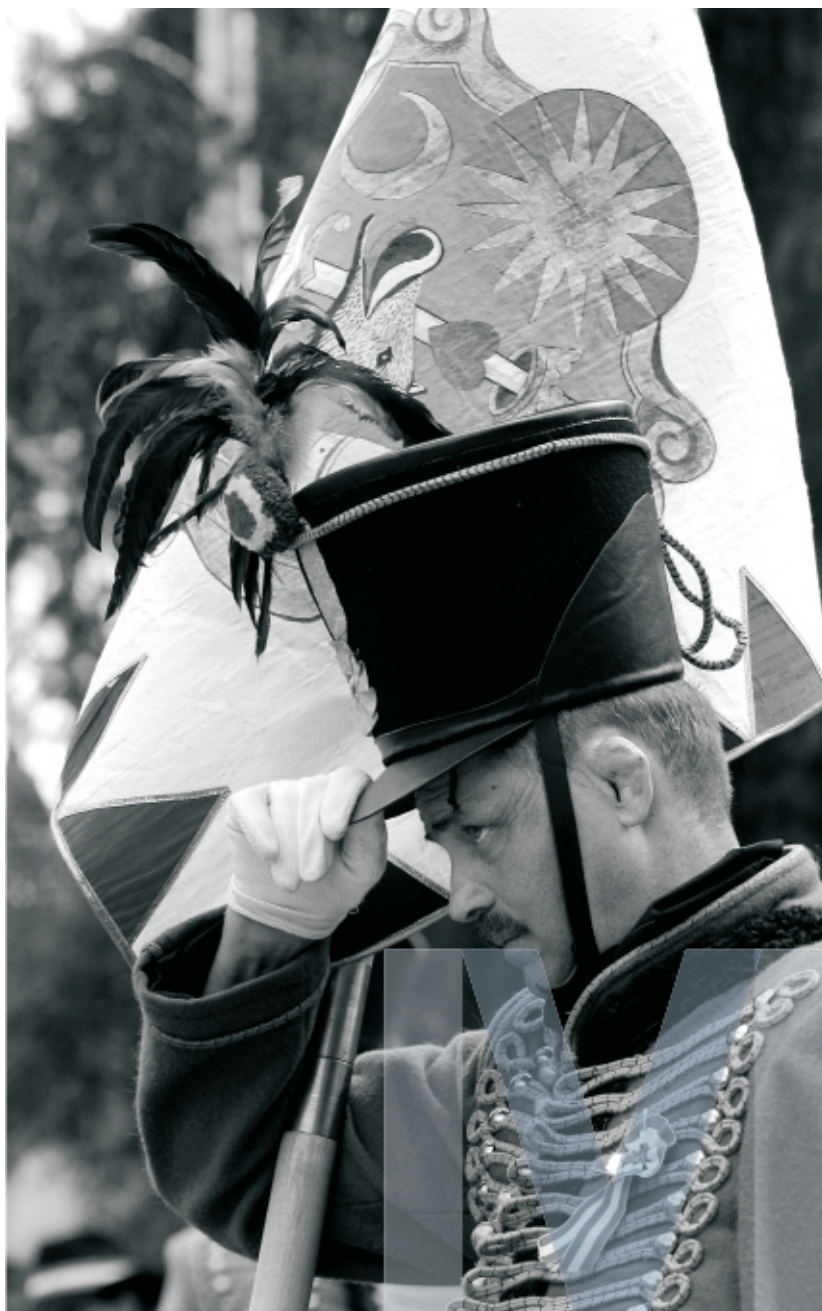
Märtsis möödus 160 aastat Austria keisri Ferdinand I vastu toimunud revolutsioonist Ungaris, mida tuhanded etnilised ungarlased tähistasid suurejoonelise paraadiga läbi Odorheiu Secuiesci (ungari keeles Székelyudvarhely – Toim.) linna Transilvaanias. Revolutsiooni tõttu loobus Ferdinand I võimust vennapoja Franz Josephi kasuks. Pildil husaarivormis ungarlane pidustustel.

1990ndate alguse revolutsioonid või rahumeelsamad muutused tõid nende ungari kogukondade ellu pöörde. Saanud tagasi peamised kodanikuvabadused ja õigused, taastasid kogukonnad viivitamata oma esindusorganid, kodanikuühendused, koolid ja kirikud. Kasutades poliitilist esindatust, võitlevad nad oma õiguste eest üksnes parlamentaarsel teel, rahumeelselt ja seadusega lubatud vahendeid kasutades. Kuna oma suure rahvaarvu tõttu suudavad nad hõlpsalt saata oma esindajad parlamentidesse, muutusid ungari vähemust esindavad poliitilised jõud Rumeenia, Slovakkia ja aeg-ajalt ka Serbia poliitilises elus arvestatavaks teguriks ja aitasid aktiivselt kaasa nende riikide ühinemisele Euroopa Liiduga. Kuid isegi nende kuulumine valitsusse ei muutnud üldiselt enamusjõudude suhtumist vähemusraha seast pärit kaasmaalastesse, et kaasa aidata nende probleemide lahendamisele.