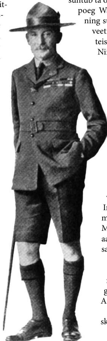
Baden-Powell of Gilwell