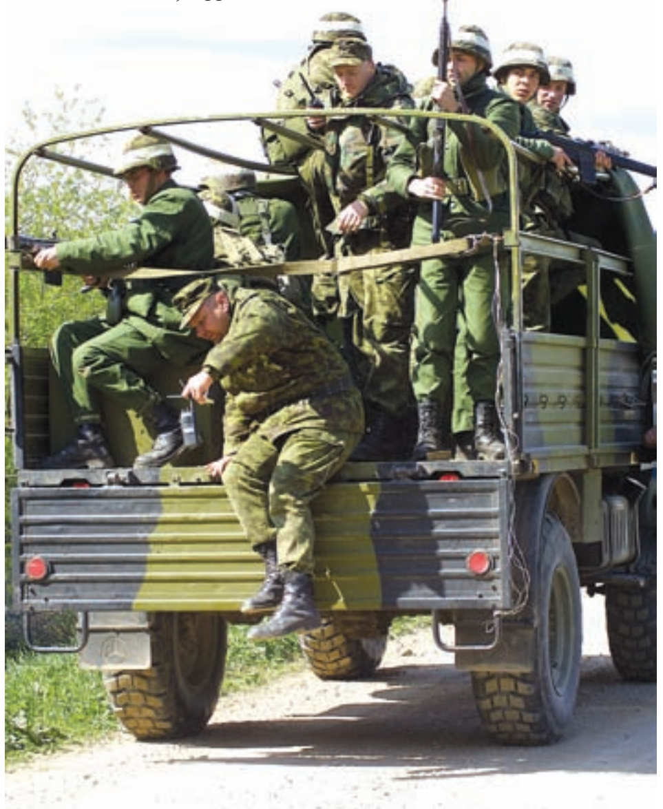
Taani riigilt kingituseks saadud Unimogid etendasid Kevadtormil vastase soomukeid. Lahingkontakti sattudes soomukis sõitev jagu jalastus ja asus lahingusse.

Kaitseliitlaste vastutegevuse pataljoni jäädgi õppusel väga rahule. Eriti rõhutati kaitseliitlaste head olukorra analüüsi võimet ja juhtimisoskust. Kaitseliitlastele endile jäi Kevadtorm meelde kui põnev ja tegevusrohke õppus, kus sai palju harjutada ja kasutada seni omandatud teadmisi. ■