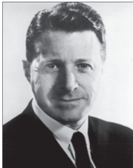
Caspar Willard Weinberger oli USA kaitseminister president Ronald Reagani ajal 1982.–1987. a.

Praegu, kus oleme harjunud, et USA sõjaline kohalolek on peaaegu ülemaailmne ja kogu maailma julgeolekupoliitika keskendub peamiselt ameeriklaste