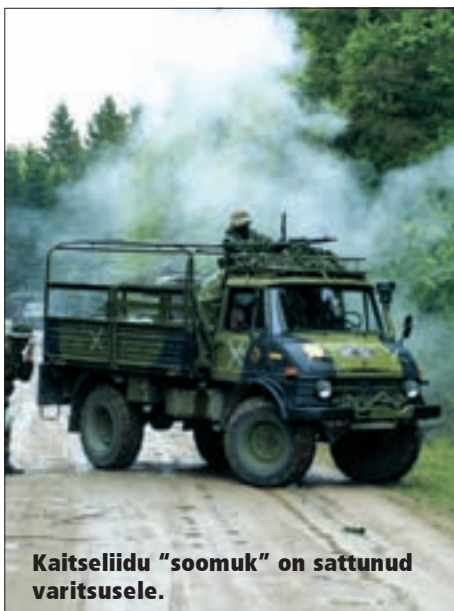
Kaitseliidu "soomuk" on sattunud varitsusele.