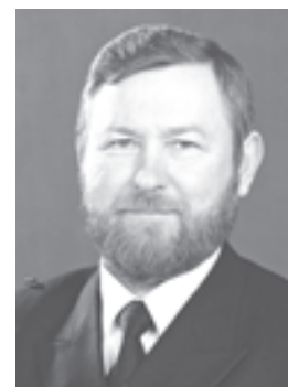
Tarmo KÕUTS, viitseadmiral, kaitseväge juhataja

Soovin teile jõudu ja tahtet reservohvitseride liikumise arendamisel!