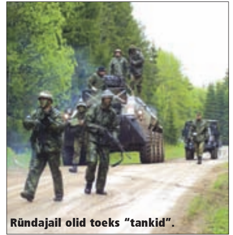
Ründajail olid toeks "tankid".