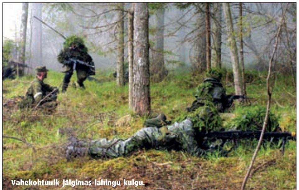
Vahekohtunik jälgimas lahingu kulgu.