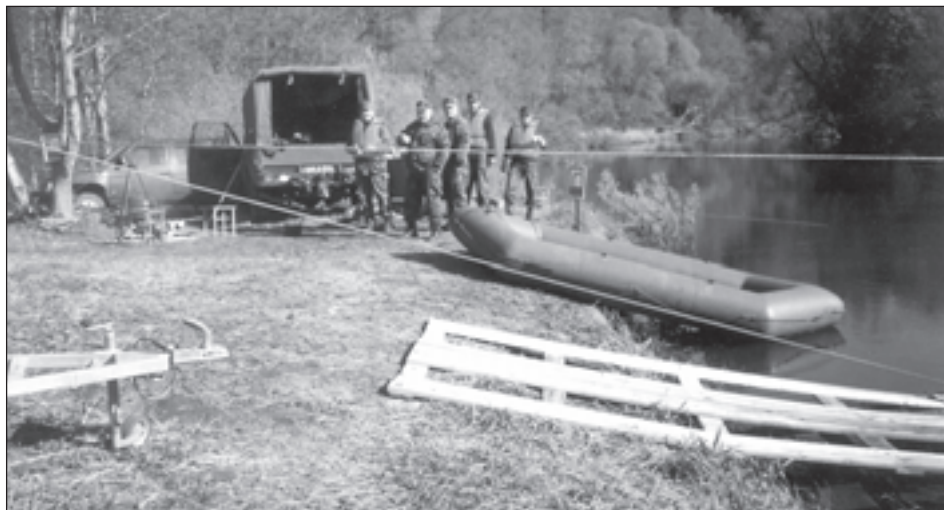
Kaitseliidu Tartu maleva jooksusilla meeskond õpetas retkelised mööda vett kõndima.

Et aga abipalvet ei tulnud, liikusid otsijad ja võistlejad üksteist segamata omasoodu. Võistluste teel võis juhtuda, et suurematest kungastest mindi energia kokkuhoiu mõttes kaarega mööda, mistõttu teekond venis mõnedel võistkondadel isegi üle viiekümne kilomeetri pikkuseks. Ääremärkusena olgu öeldud, et stardi ja finiši geograafiliste kõrguste vahe oli 130 meetrit, kusjuures teekond kulges kogu aeg ülespoole. Aja-