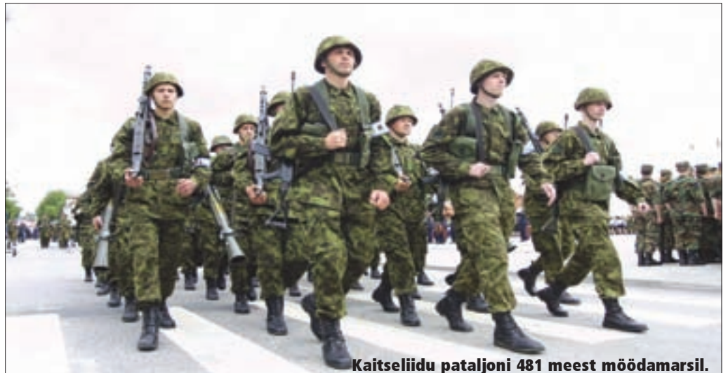
Kaitseliidu pataljoni 481 meest möödamarssil.