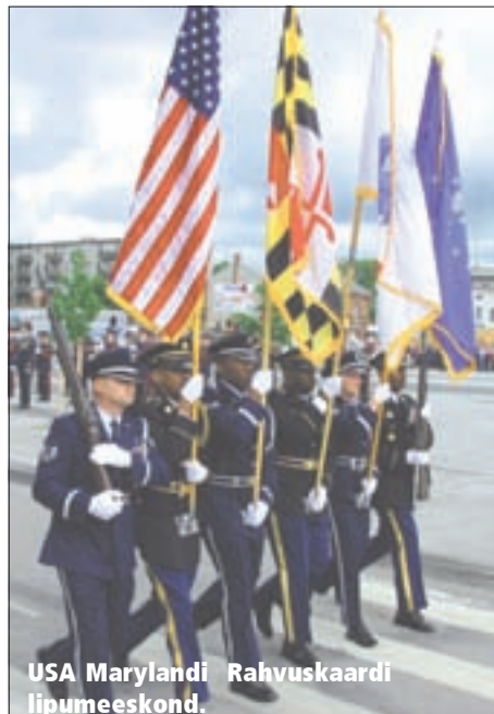
USA Marylandi Rahvuskardi lipumeeskond.