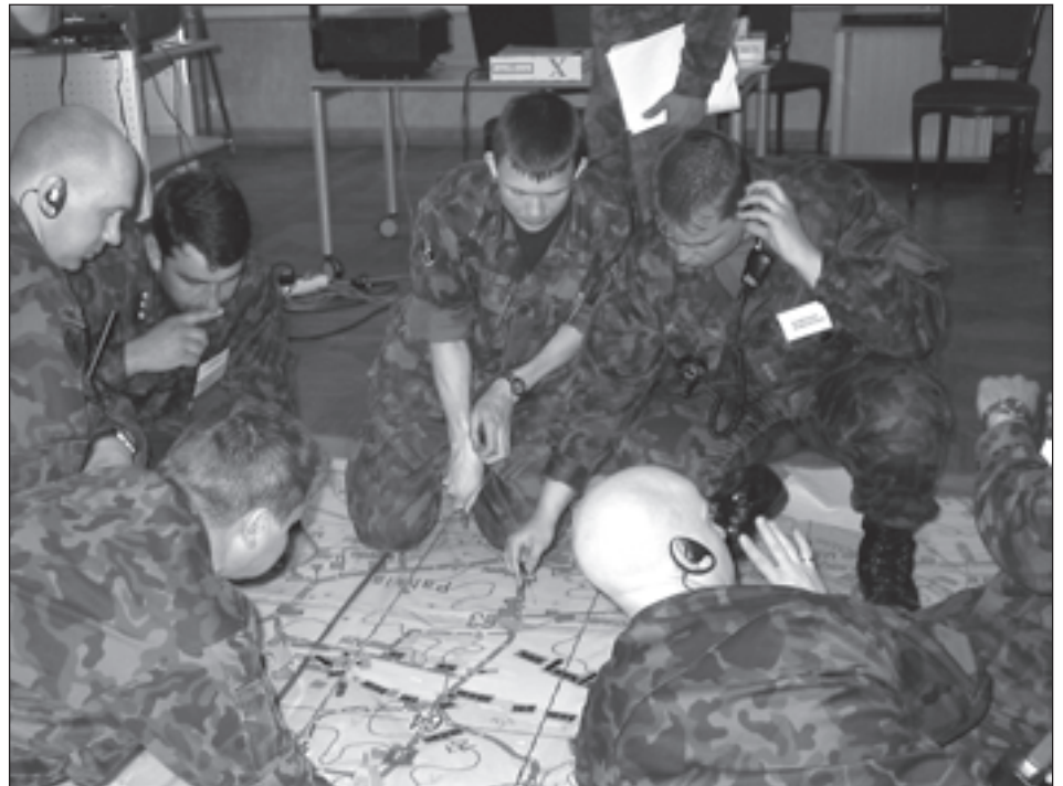
Balti Kaitsekolledži Taktikatreeneri spetsialistid andmas Kaitseliidu Kooli kolleegidele juhtnõore uue väljaõppekeskkonna kasutamisel.

Süsteem võimaldab mängida kaardil vähese ajakulu ja vähete vahenditega läbi erinevaid taktikalisi olukordi ja analüüsida õpetatavate tegevust side-, staabi- ja lahinguprotseduuride läbiviimisel ilma maatikule mineku ning reaalseid allüksusi ja relvasüsteeme kasutamata. Treeningusüsteem võimaldab treenida allüksuse ja üksuse ülemaid (alates rühmaülemast) ning erinevate staapide koosseise. Võimalik on treenida ka staapide koostööd. Treeninguseade võimaldab imiteerida ka erinevaid hädaolukordi ja päästeoperatsioone. Seega on Taktikatreener rakendatav ka erinevate jõustruktuuride rahuaegsete ülesannete ja õppevajadus-