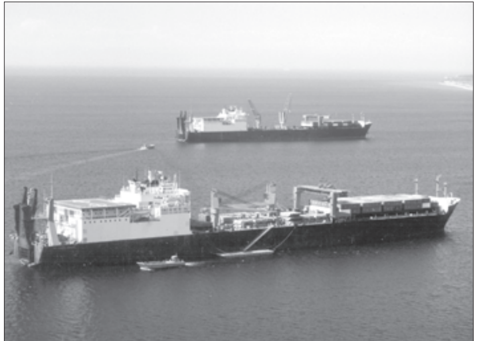
USA merejalaväe eelasetuslaevad Eesti rannikul suurõppusel Baltic Challenge '97. Eestil tuleks endale selgeks teha, milliste Weinbergeri kriteeriumide korral oleks võimalik USA sõjaline sekkumine Eesti kaitseks.

Sõjaliste ja poliitiliste eesmärkide selge defineerimine on samuti justkui väga lihtne kriteerium. Samas ei tohi unustada, et sõjalis-poliitiline olukord mis tahes kriisikoldes on pidevalt arenev ja muudatused võivad olla väga kiired ja drastilised. Niisiis võivad ka kriisi puhkemise hetkel selgetena näivad eesmärgid kriisi arenedes muutuda, hägustuda või üldse kaduda.