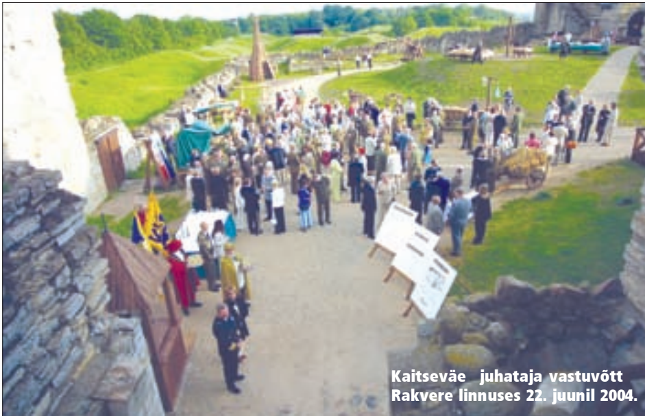
Kaitseväe juhataja vastuvõtt Rakvere linnuses 22. juunil 2004.