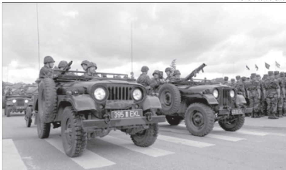
Võidupäeva paraadil Rakveres näitas ennast esmakordselt rahvale täies varustuses Kaitseliidu pataljon.

Kehalise kasvatuse ja spordi alal viidi läbi nii spordi- kui ka sõjalis-sportlikke üritusi. Korraldati malevasisesed spordiüritusi, osaleti üleriigilistel ja rahvusvahelistel üritustel. Kõige arvukamalt viidi malevates läbi laskevõistlusi, üldfüüsilise taseme tõstmiseks korraldati spordipäevi ja orienteerumisvõistlusi,