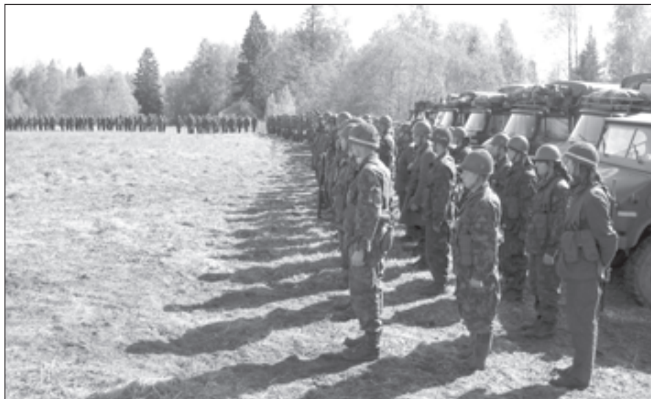
Tänavusel kaitseväge suurõppusel Kevadtorm 2004 sai erinevate malevate lahingüksustest moodustatud Kaitseliidu Tallinna pataljoni oma lahinguristsed.