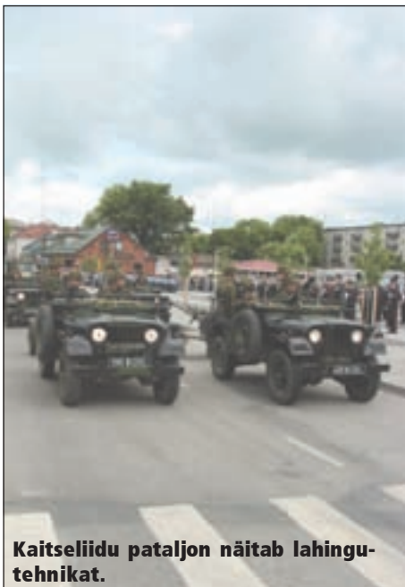
Kaitseliidu pataljon näitab lahingu-tehnikat.