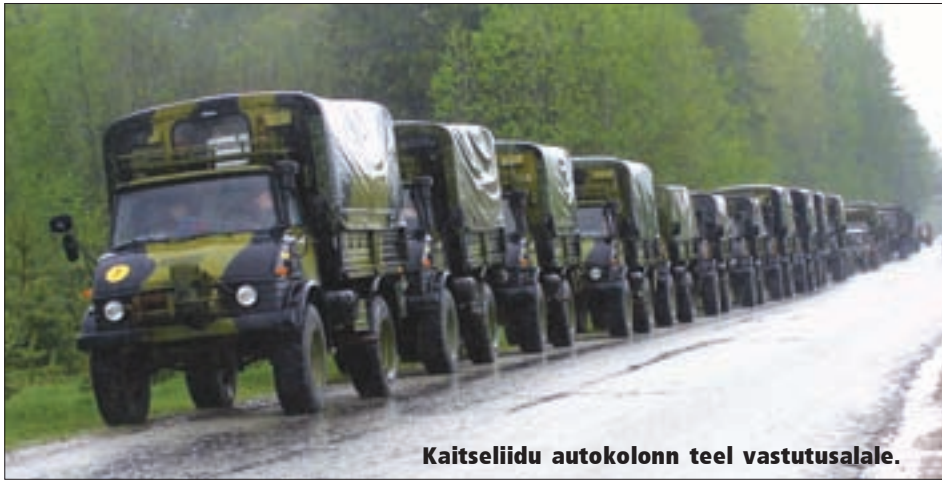
Kaitseliidu autokolonn teel vastutusale.