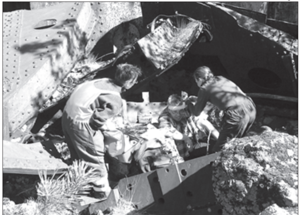
Kaitseliidu päästerühm õppusel: Tallinna Nõmme malevkonna naiskaitseliitlased annavad esmaabi Aegna suurtükipatarei varemetsesse kukkunud kannatanule.

Kaitseliitlaste rakendamise juriidiliseks aluseks on ühelt poolt päästeseaduse 16. paragrahvi 2. lõike järgi tulekustutus- ja päästetööde juhi õigus rakendada tulekustutus- ja päästetöödel töövõimelisi füüsilisi isikuid alates 18. eluaastast, teiselt poolt Kaitseliidu seaduse § 18: (1) Tuletõrje- ja päästeteenistuse volitatud isiku taotlusel võib Kaitseliidu lähima üksuse pealik anda oma alluvatele hädaolukorras käsu osaleda tuletõrje- ja päästetegevuses, kandes sellest ette oma vahetule pealikule. (2) Tulekustutus- ja päästetöödes osalemise ajal allub Kaitseliidu liige päästetööde juhile.