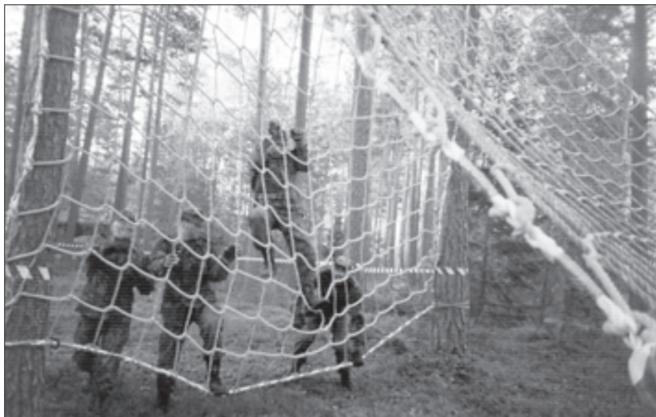
Kaitseliidu Eel-Erna on ikka osavõtjatele uudseid ülesandeid pakkunud, seekord tuli näidata oma ämblikmehe osavust.

Tänavune võistlus sattus saatuse tahtel aset leidma samas paigas, kus