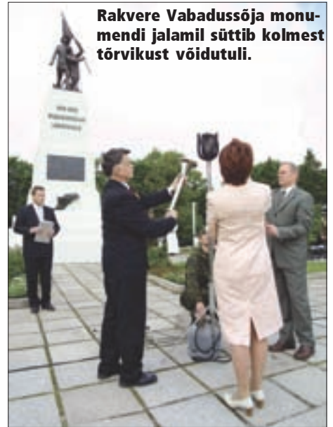
Rakvere Vabadussõja monumendi jalamil süttib kolmest tõrvikust võidutuli.