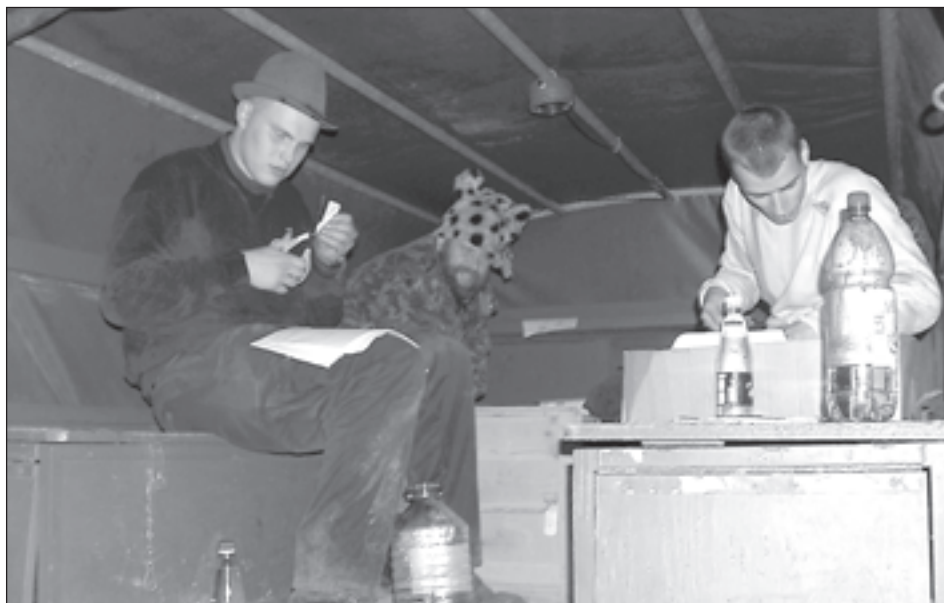
Üks trallajate paar "propuskit" võltsimas. Ühel võistlejal ei ole õnnestunud veel vabaneda luminestsentslillade triipudega vangirüüst. Taamal paistab õnnelik "Metsa-Tupsu".

Kuid nagu selliste peente asjadega ikka, tuli propuskit kokku kleepides olla tähelepanelik: kui ikka koju ihkav põgenik kasutas kiirustades blanketti, kuhu oli trükkali vea tõttu sattunud tekst "selles dokumendi esitaja on saamatu võltsi-