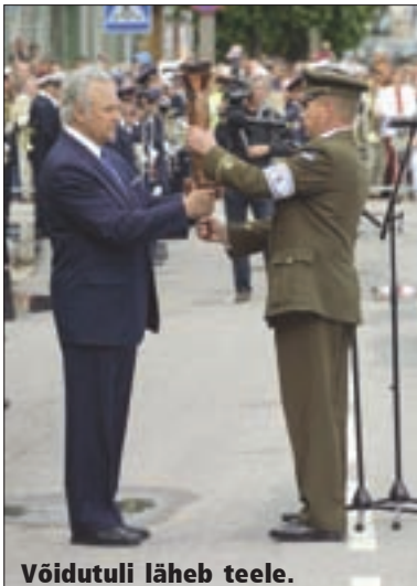
Võidutuli läheb teele.