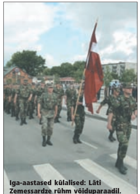
Iga-aastased külalised: Läti Zemessardze rühm võiduparaadil.