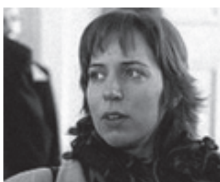
MAILIS REPS Haridusminister

Tänapäeval räägitakse hariduse kvaliteedist palju, seda rõhutavad ka Euroopa direktiivid. Kvaliteetse hariduse probleem on tähtsaim poliitiline prioriteet paljudes riikides. Mitte igal pool pole kogemus erivajadusega inimeste koolitamisel nii pikk kui näiteks Rootsis, kuid meilgi on