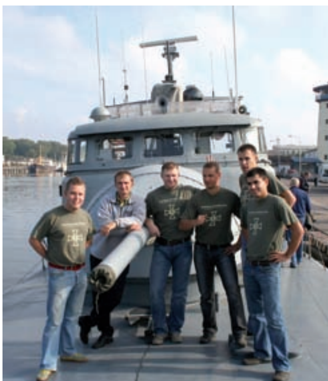
Baltjolds 2006 Lätis Liepajas. Eesti Reservohvitseride Kogu meeskond Läti sõjalaeva Zirenis pardal.

Lisaks õppetööle tutvustati seminari ajal ka Liepaja vaatamisväärsusi ja ajaloolisi väeosasid - Balti Sukeldumiskooli, mereväebaasi jt. Tippküsimusteks võib pidada Liepaja Ka-