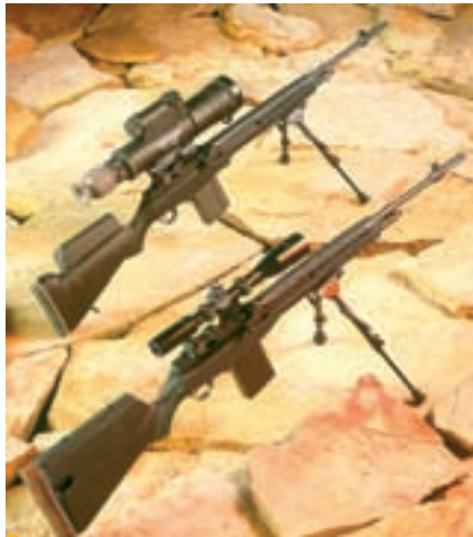
USA sõdurid on Iraagis täiustanud poolautomaatvintpüssi M 14.

Ümberehitatud M 14 peamiseks puuduseks oli see, et relva uus kaba oli taas konstrueeritud rauast tava-sihiku kasutamist silmas pidades. Standardsest dioptersihikust lastes ei ole püssi lasujärgne kerkimine kuigi tugev ja rihma kasutades lamades asendis on võimalik teostada “järelsihtimist” edukalt ka käelt. Et optika kinnituseks kasutatakse