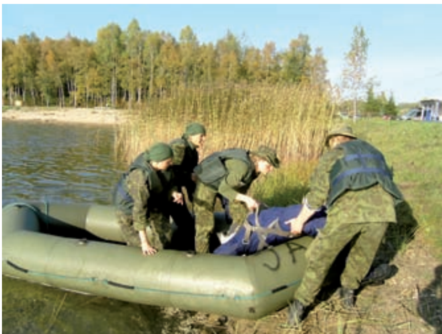
Paadisõidul tuli päästa uppumissurmast kaltsunukk. Samas pidi tähelepanelikult jälgima, kellega on tegemist, sest järgmises postkasti punktis tuli aru anda, mis on nuku nimi, auaste ja üksus, kus ta teenib.

Samas on ebaeeldivad vahejuhtumid rajal ka head – nad juhivad mõtteid väsinud lihastelt kõrvale. Astud vaikides oma rada edasi (vaikisime ikka selleks, et meid ei avastataks ega märgataks) ja mõtiskled, miks nii juhtus, mis sai tehtud valesti, otsid lahendusi ja kaalud teisi võimalusi ning kilomeetrid muudkui kuluvad, ilma et tajusid, kuidas teed treenimata lihastega üle jõu käivaid pingutusi.