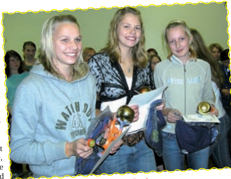
Oskuste võistluse võitjad – Saaremaa kodutütred.