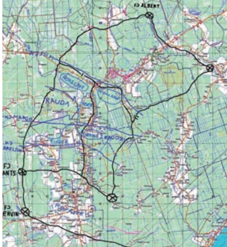
Kevadtormi 2006 tegevuskäik kaardil.

Et C-kompanii oli pataljoni õnnetuseks pärast Kopro talu silla õhkimist oma 1. rühma Avinurme asula eest ära toonud (hindamatu kogemus