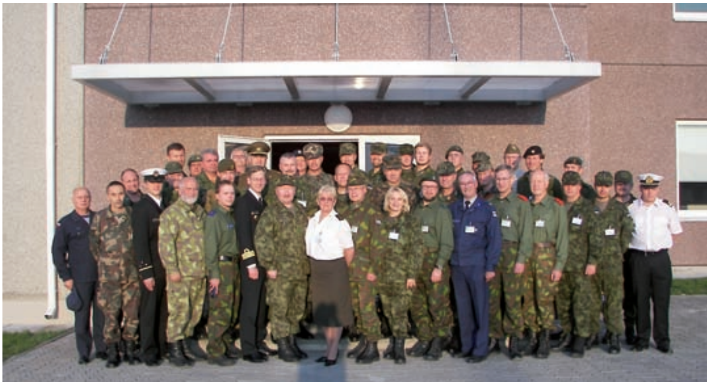
Baltic Talks'ist 2006 osavõtjad Tapa Väljaõppekeskuses.

Almann kinnitas muu hulgas koostöö toimumist EROK ja ministeeriumi vahel nii Kaitseliidu moderniseerimise küsimuses kui ka mõnes teises avalikus kaitsepoliitilises arutelus.