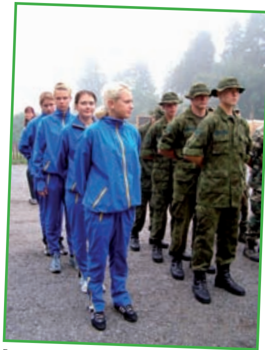
Eesti esindus rivistusel.

Järgmine noorte mitmevõistlus on samas paigas Vällinges tuleva aasta