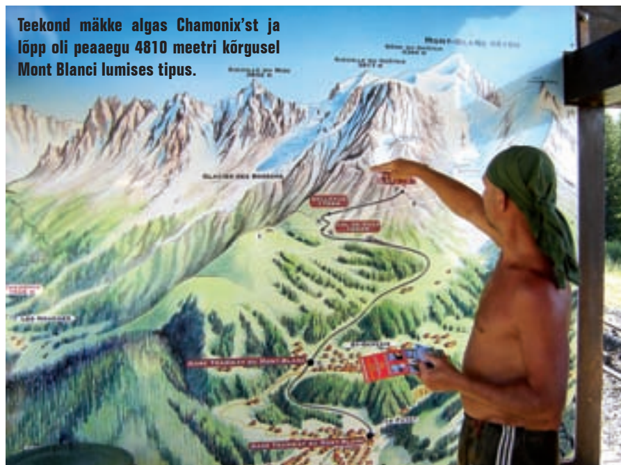
Teekond märke algas Chamonix'st ja lõpp oli peaaegu 4810 meetri kõrgusel Mont Blanci lumises tipus.

A lpide kõrgemasse märke hakatakse tõusma öösel: ühelt poolt seetõttu, et päikesetõusuga avaneb mäelt võrratu vaade, teisalt pääseb öise ülesminekuga hommikuse sula eest.