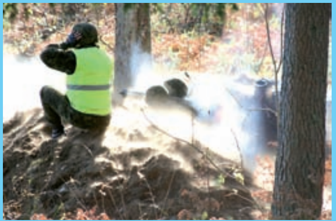
Kaitseliidu Tartu maleva reservõppekogunemise ajal korraldatud lahinglaskmisene Utsali laskeväljal 6. oktoobril 2006.