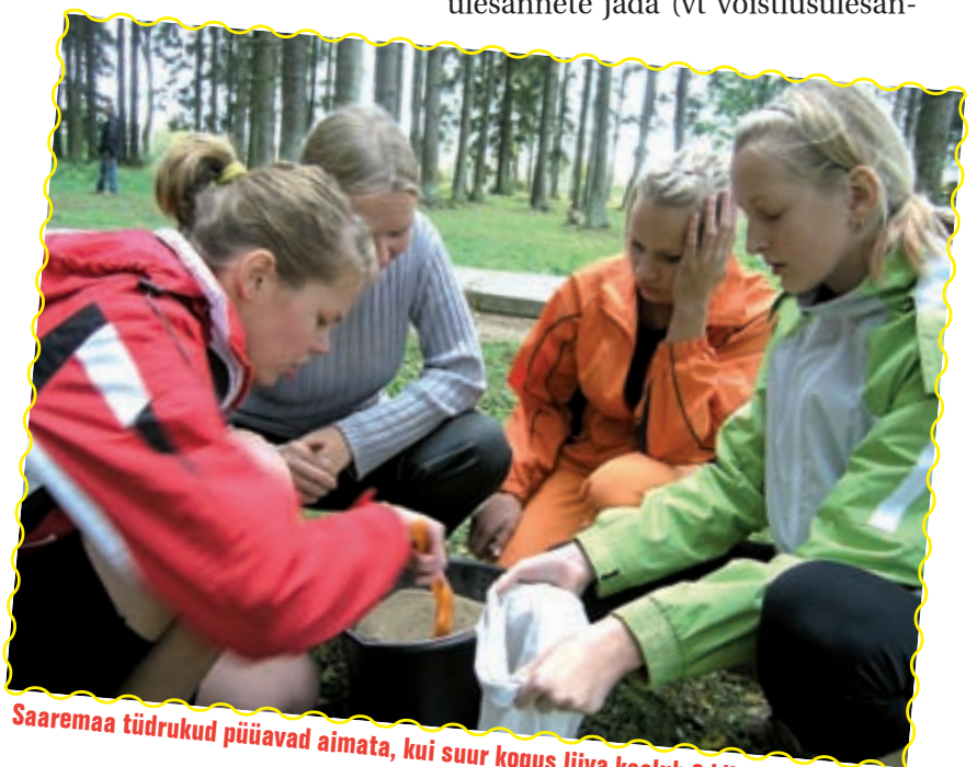
Saaremaa tüdrukud püüavad aimata, kui suur kogus liiva kaalub 2 kilogrammi.