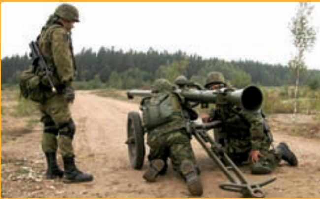
Kaitseliidu Tallinna maleva lahinglaskmine Potsepa karjääris 1.–3. septembrini 2006, mille käigus osavõtjad nägid, kuidas mõjub Eestis kasutada olevate tankitõrjerelvade tabamus kahele autovrakile.