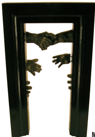
Märgusõna "Vabaduse värav" all esitatud kavand.

Esmamulje näitas kõigi võistlustööde professionaalselt kõrget taset, läbimõeldud lahendusi ja erinevaid väljendusvorme. Algusest peale jäi komisjoniliikmetele silma üldistav võistlustöö "Murtud müür", mis kujutab keskelt katki rebitud jäist klaastahukat, mille sisse on paigutatud Eesti ajalugu mõjutanud oluliste dokumentide (Molotovi-Ribbentropi pakti salaprotokollid jm) katked. Autorite mõttel väljendas monument, mis koosnes erinevatest 2 cm pakustest kokkuliimitud klaaskihtidest, konstruktsioonist tulenevalt valguse murdumise, reflek-