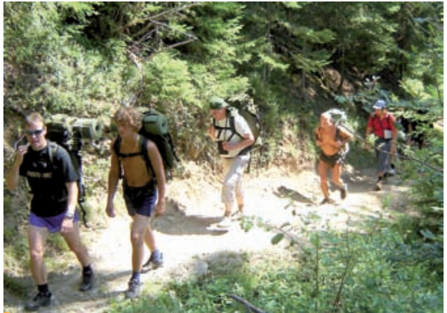
Esimesel aastal tähendab praktiline õpe liikumist mööda radasid, kuid iga aastaga muutub teekond raskemaks.

Mägede tundmine tagab sõjaväelastele oskuse maastikku hinnata. Valida tuleb kergem tee ja osata hinnata, kus võib tekkida oht, et