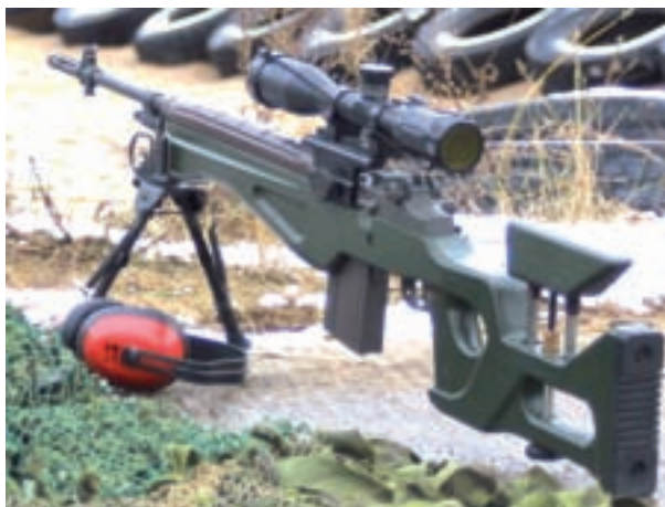
Eestis täpsusrelvaks ümberehitatud M 14.

Need on vaid oletused. Teadaolevalt on tänasel päeval Kaitseliidu malevatel vaid üksikud M 14-d ja seetõttu on ka võimalused edasisteks “katsetusteks” üsna piiratud. Kui sellealased arendustööd aga kusagil M 14 baasil jätkuvad, soovin vastavatele ametimeestele edu ja jõudu ning soovitan tihedat laskevälja küllastamist relva ümberehituse ajal. KK!