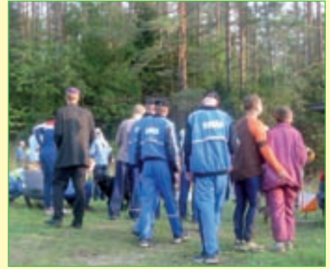
Orienteerumispäevakul pääseb starti igaüks, nii sõjakooli kursant kui ka värvimütsis korporant.

(Allikas: http://www.orienteerumine.ee )