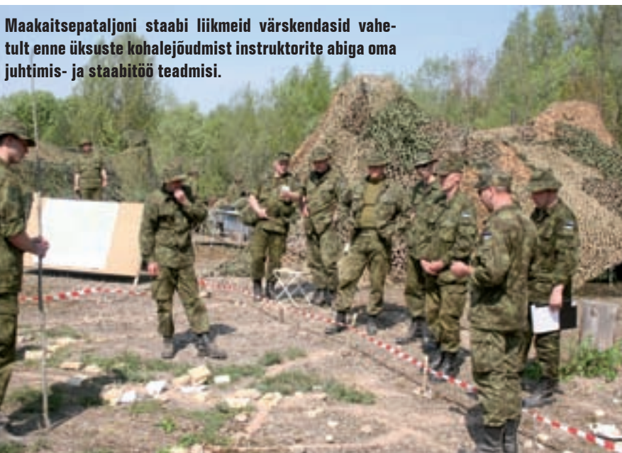
Maakaitsepataljoni staabi liikmeid värskendasid vahe-tult enne üksuste kohalejõudmist instruktorite abiga oma juhtimis- ja staabitöö teadmisi.

Klaarisime segadust ka kaugtule laskemoonakulu osas, olime oma arvutuste järgi kolmandiku meile ettenähtud normist ära kulutanud, tulemõjude mõõtühikud aga polnud meil ja vahekohtunikel sünkroonis. Vahekohtunikud arvestasid tulelöökidega (ühelt 120 mm relvast kaheksa lasku), meie aga kasutasime laskmiskordasid. Minnes üle tulelöökidega arvestamisele, saime aga brigadist laskemoona kulutamise osas piirangu (seega pöörati senine arvestus pea peale). Virtuaalse miinipildujapatarei moonakulu oli 24. mail olnud 0,6 lahingukomplekti. Seega oli tagasiside kaugtule efek-