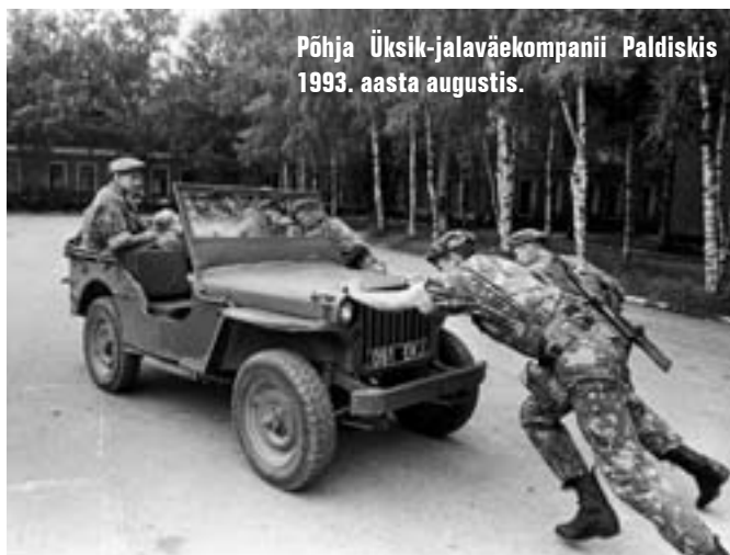
Põhja Üksik-jalaväekompanii Paldiskis 1993. aasta augustis.