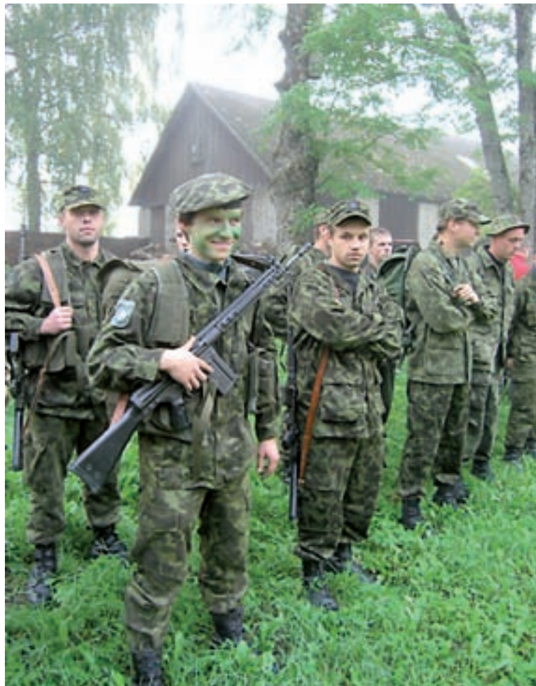
Avarivistusel on meeste näod alles õhinat täis. Ees ootab kiire ja vastutegevust tihedalt täis pikitud võistlusrada.