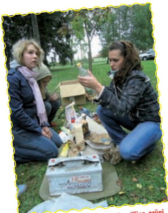
Pärnumaa kodutütred nuputavad, milline prügi on keskkonnale ohtlik.

ringkonnast. Tegevus oli jagatud kolme blokki. Saabumisõhtul testiti võistkondade teadmisi, teise päeva ennelõunal pandi end proovile spordis ja pärast lõunat läbisid tüdrukud Kodutütarde oskusi nõudvate ülesannete jada (vt võistlusülesan-