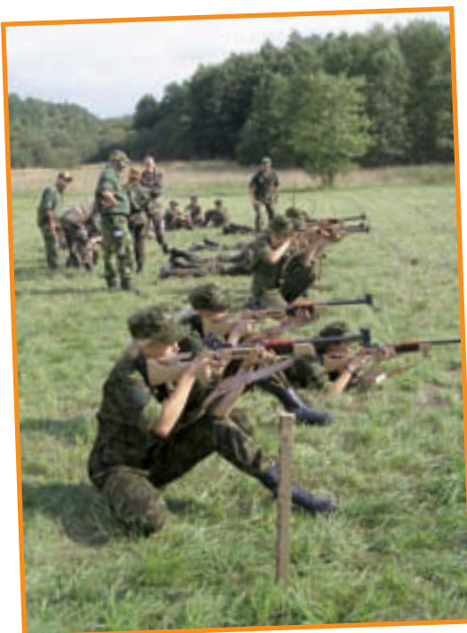
Noorte üheks lemmikalaks kujunesid laskevõistlused kvaliteetsetest spordipüüsidest.

Võistlus kulges ladusalt. Oma osa oli siin korraldusmeeskonnal, kuhu