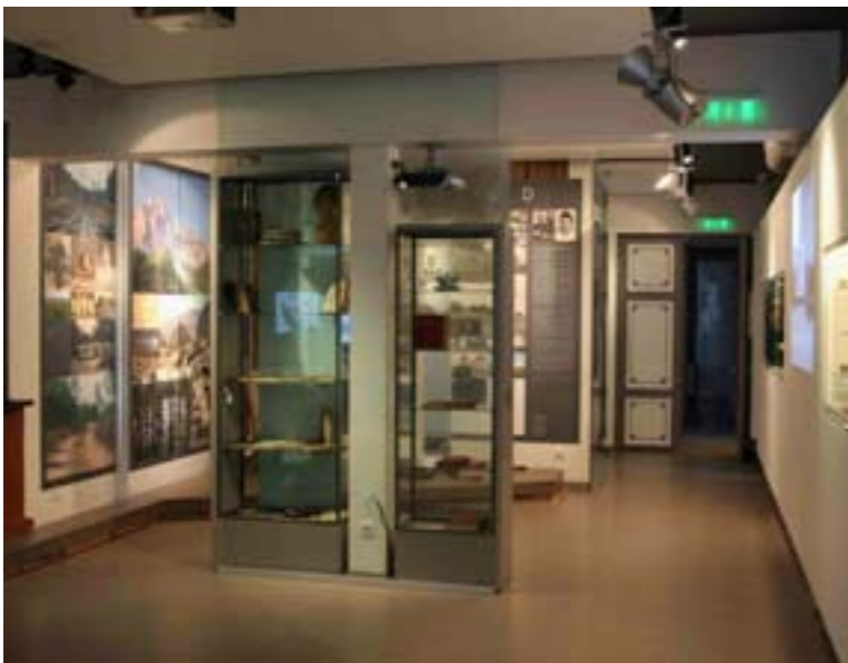
Vaade Tammsaare muuseumi ekspositsioonile

tada ära võimalikult palju kaasaegseid, kõitvaid detaile ja mõtteid, mis muuseumides edukad on olnud. Siinkohal oli probleemiks natuke see, et kirjaniku muuseumis ei saa paratamatult rakendada samasuguseid võimalusi ja nippe kui näiteks mänguajamuuseumis. Samuti on küllaltki keeruline leida piir atraktiivsuse ja pealiskaudsuse vahel. Tammsaare puhul aga oli meie eesmärgiks kindlasti luua tõsiseltvõetav ja põhjalik näitus (tegemist on ikkagi mitte ajutise, vaid püsinäitusega), sealjuures aga jäämata raskepäraseks, igavaks või stereotüüpseks.