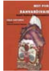
Reet Piiri RAHVARÕIVAD EESTI RAHVA MUSEUMIST. FOLK COSTUMES FROM THE ESTONIAN NATIONAL MUSEUM ERM, 2006.

Eesti- ja ingliskeelne raamat annab rikkaliku fotomaterjaliga illustreeritud ülevaate erinevate Eesti piirkondade rahvarõivastest. Eraldi leiavad käsitlemist Põhja-Eesti, Lõuna-Eesti, Lääne-Eesti ja saarte rõivastuse eripärad. Väljaandja: Schenkenberg OÜ. Kujundus: Jana Reidla.