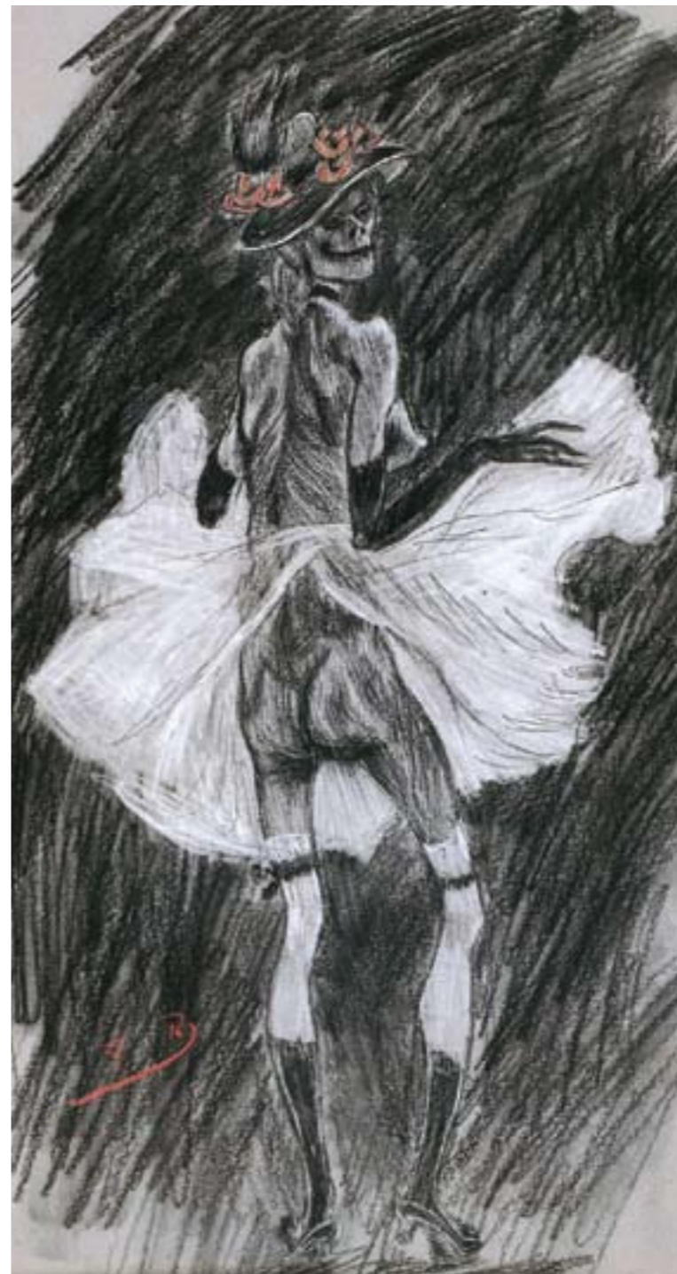
Félicien Rops TANTSIV SURM 1865 Pliiats, pastell, valge kriit

erineva kuju, et üheaegselt töötavad erinevad koodid: massitarbijat tõmbab alasti keha kui vihje seksuaalsusele ja selle kunstisaalis nägemise magus põlgus, ilunautleja uurib graafikajoone ja -tehnikate elegantsusest, paadunud intellektuaal naudib näitusel kaardistatud 19. sajandi Prantsuse kultuurimaastiku rikkust, erotomaan tunneb rõõmu, et eluline asi on “kapist” välja toodud. Osavates kätes on muuseumil hirmuäratav manipuleerimisvõime, ka erinevate vaimse turvalisuse tsoonide loomisel.