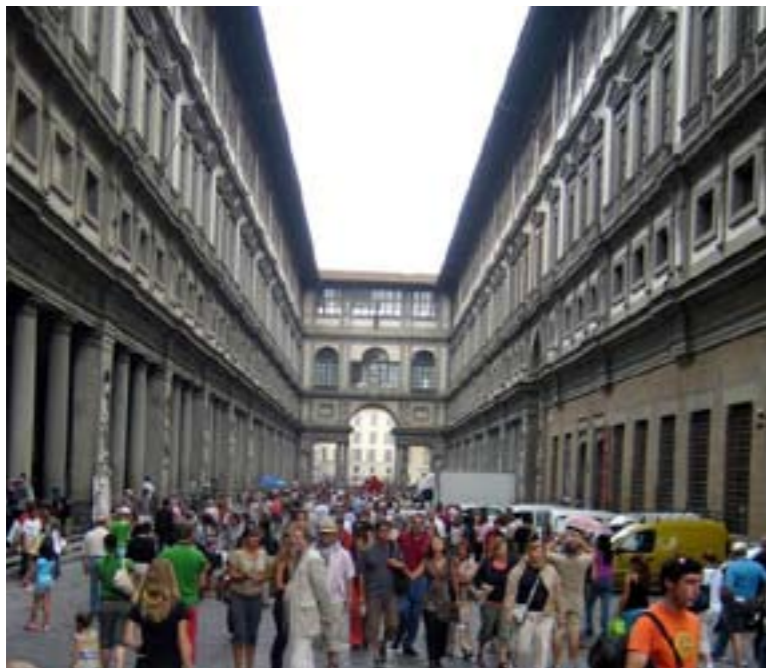
Uffizi galerii sissepääsu-tänaval tungleb pidev rahvavoog.

ritud hoidla seintel. Ka kõik installatsioonid on täpselt sellised nagu nad peavad olema näituse saalis, vaatamata sellele, et kokkupakituna võtaksid nad kümneid kordi vähem ruumi. Robert Goberi installatsioonile „Nimetu” on siin näiteks hoidlas eraldatud 261 m 2 ja Katharina Fritschi „Rotikuningale” 393 m 2 . Printsibi läbiviimise kvintessentsiks on ruum, kus hoitakse videoid. Enne hoidlasse sisenemist käivitatakse kaugjuhtimisega videod ning siseneja näeb neid juba täpselt nii nagu näitusel. Nii on kaheksa video hoidmiseks eraldatud ei vähem ega rohkem kui ca 80 m 2 hoidlaruumi. No budget.