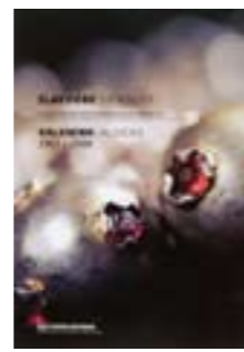
ELAV HÕBE. EESTI RAHVAPÄRASED EHTED EESTI RAHVA MUUSEUMI HÕBEDAKOGUST Kalender 2007/2008 QUICK SILVER. ESTONIAN FOLK JEWELRY FROM THE ESTONIAN NATIONAL MUSEUM'S SILVER COLLECTION Kalender 2007/2008. ERM, 2006