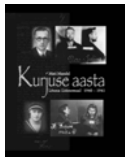
Mati Mandel KURJUSE AASTA LÕUNA-LÄÄNEMAAL 1940–1941 Eesti Ajaloomuuseum, 2007 Suureformaadiline teos annab üle-

Eesti Ajaloomuuseumi perioodiline väljaanne pakub sissevaadet muuseumi teadustöötajate viimaste aastate uurimisteades. Koostajad ja toimetajad: Aivar Pöldvee, Ivar Leimus, korrektuur: Viivi Glass, resümeeide tõlge: Kirill Lebed, kaas: Rein Seppius, Aime Andresson, fotod ja skanneeringud: Tõnis Liibek, Vahur Lõhmus.