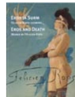
EROS JA SURM. FÉLICIEN ROPSI LOOMING Eesti Kunstimuseum, 2006