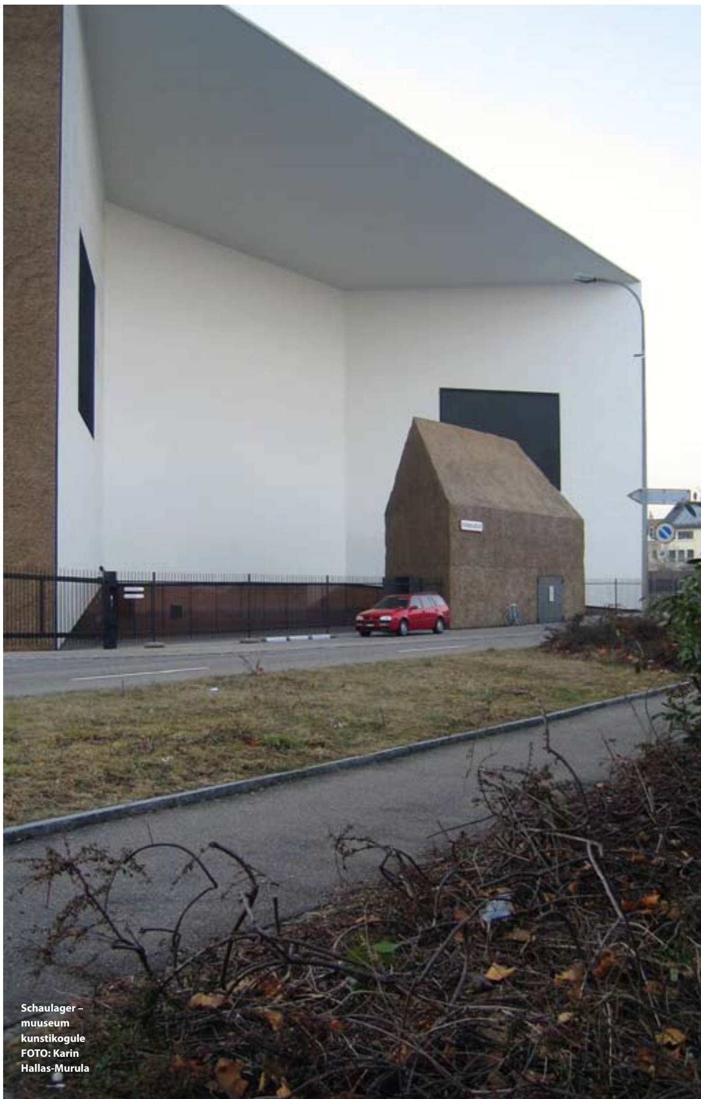
Schaulager – muuseum kunstikogule