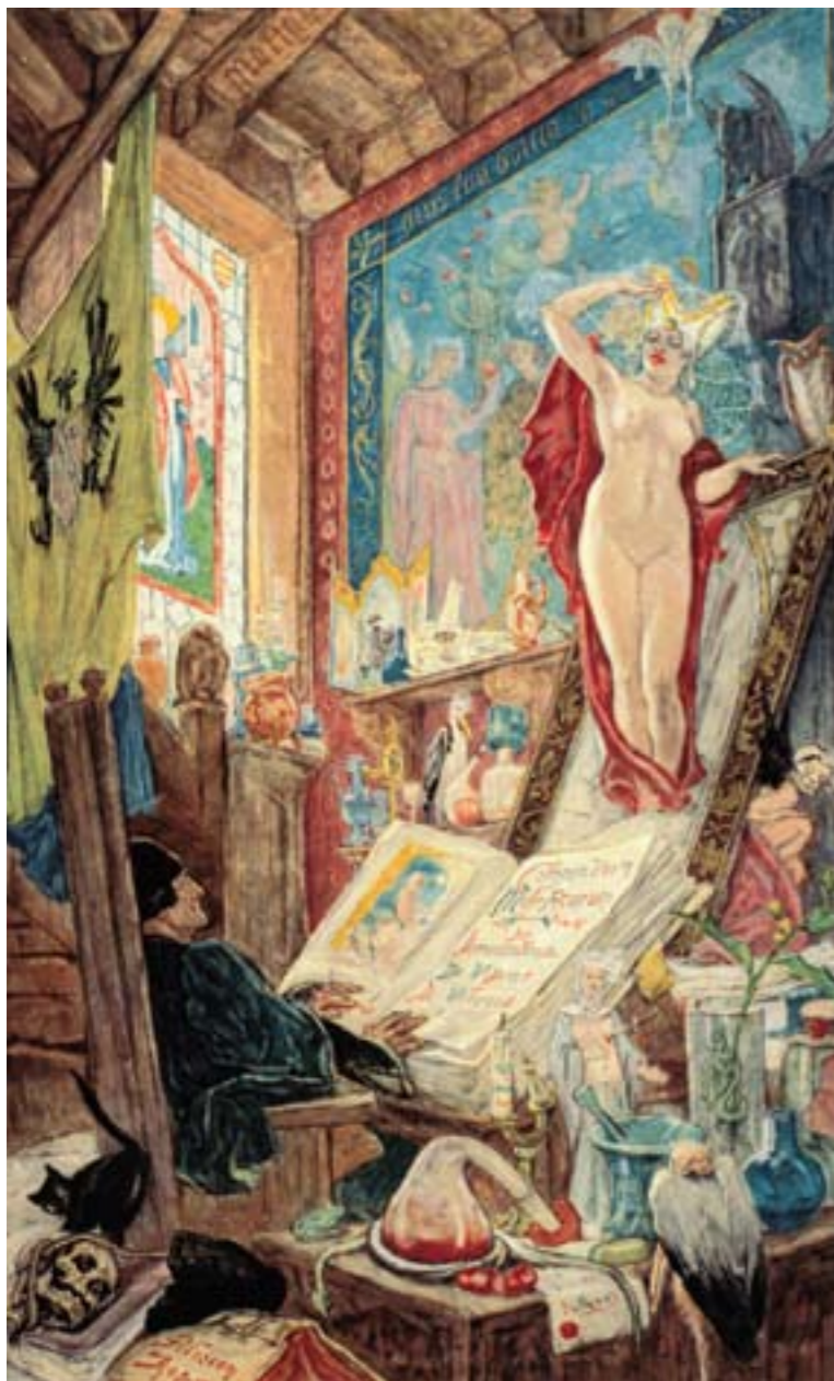
Félicien Rops OHVERDUS 1882 Heliogravüür, pehmelakk

pidi 19. sajandi “erootiku” Ropsi looming ka suurimatele moralistidele tunduma süütu ja esteetilisena. Ent näitusega seoses kerkis üles hoopis laiem ja huvitavam muuseumikeskkonna vaimse turvalisuse küsimus. Kui otsustada diskussioonide sisu põhjal, häiris eriti ajakirjanikke häbitu alasti keha “sissetung” kunstiklassikat eksponeerivasse näituseruumi, sest seda peeti harjumuspäraselt esteetilise naudinguga saamise, ajatu ilu, meisterlike joonte ja kaunite värvide kohaks. Seksi, kannatuse, füüsilise inetuse, surma ja prostitutsiooni (loetelu võiks jätkata) sissetung muuseumi ekspositsioonisali tundus otsekui kahandavat külastajate turvatunnet.