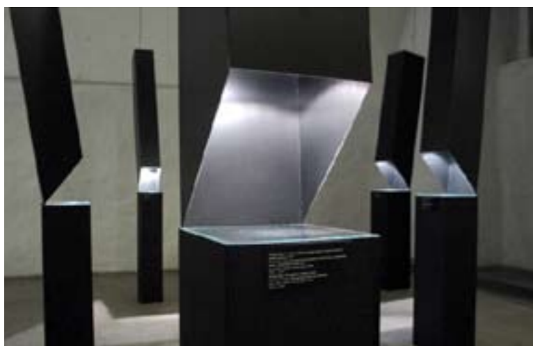
Näitus „Klassikud. Leili Kuldkepp“ Tarbekunsti ja Disaini- muuseumis

„Valge pluus ja must pluus. “Käsitööleht” 1907–1914“ – silmapaistva tasemega koostöö