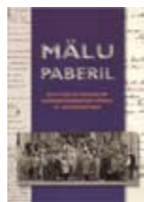
MÄLU PAPERIL. EESTI RAHVA MUUSEUMI KORRESPONDENTIDE VÕRGU 75. AASTAPÄEVAKS. ERM, 2006.