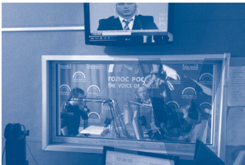
Raadiojaama „Venemaa Hääli” stuudio.

Niisiis määrati 2009. aasta maikuu kindralleitnant Vladimir Šamanov õhudesantvägede ülemjuhatajaks. Veidi hiljem määrati 76. Pihkva õhudesantdiviisi komandör kindralmajor Aleksandr Kolpatšenko Venemaa merelaevastiku rannavägede ülemjuhatajaks. See tähendab, et merejalaväge hakkas juhatama üks kõige kogenumaid dessantvägede komandöre.