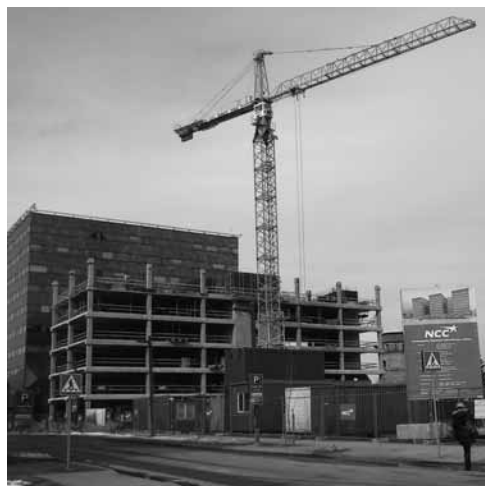
Tallinn. Technopolis Ülemiste büroohooded. Valmimine 2013 sügis