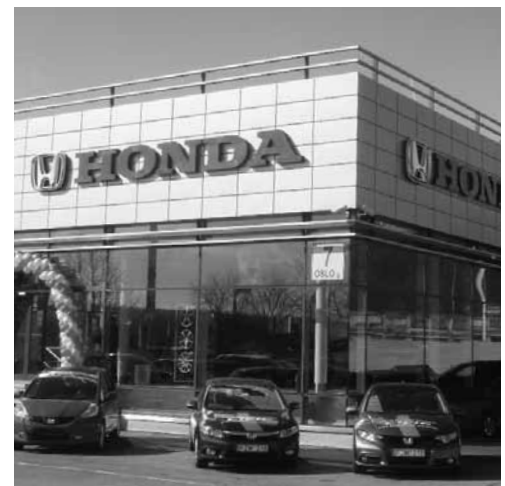
Vilnius. Honda müügikeskus. Valmis märts, 2012