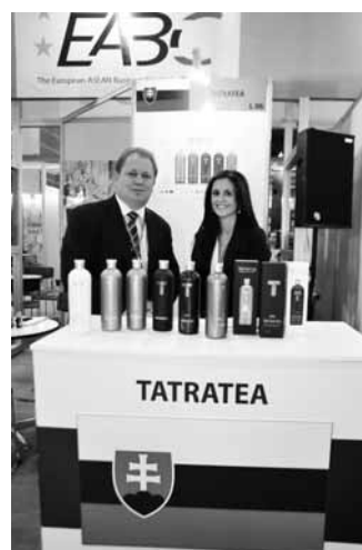
EABC boks messil Food and Hotel 2012.