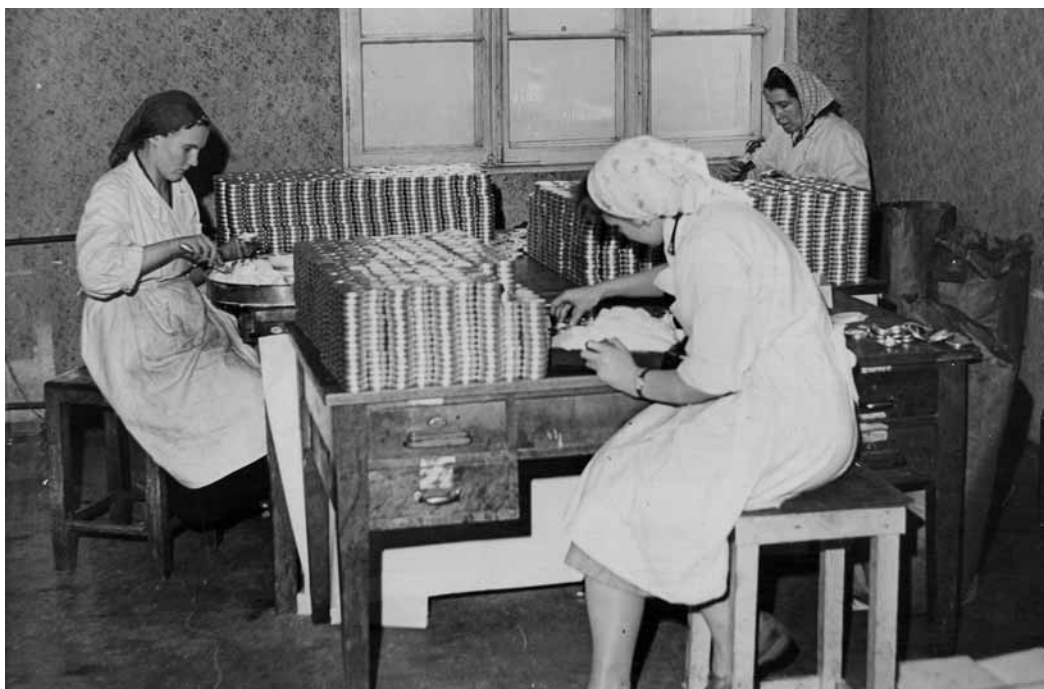
Orto kreemipakkijad 1950ndatel.