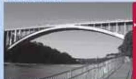
Tee- ja sillauuringud