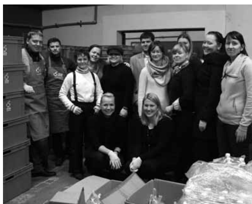
Toidupakkide komplekteerimisel abiks olnud Kaubanduskoja töötajad.

Kas teadsite, et Eestis on täna umbes 63 000 last, kes elavad peredes, kus vanematel on raskusi