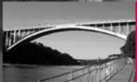
Tee- ja sillauuringud