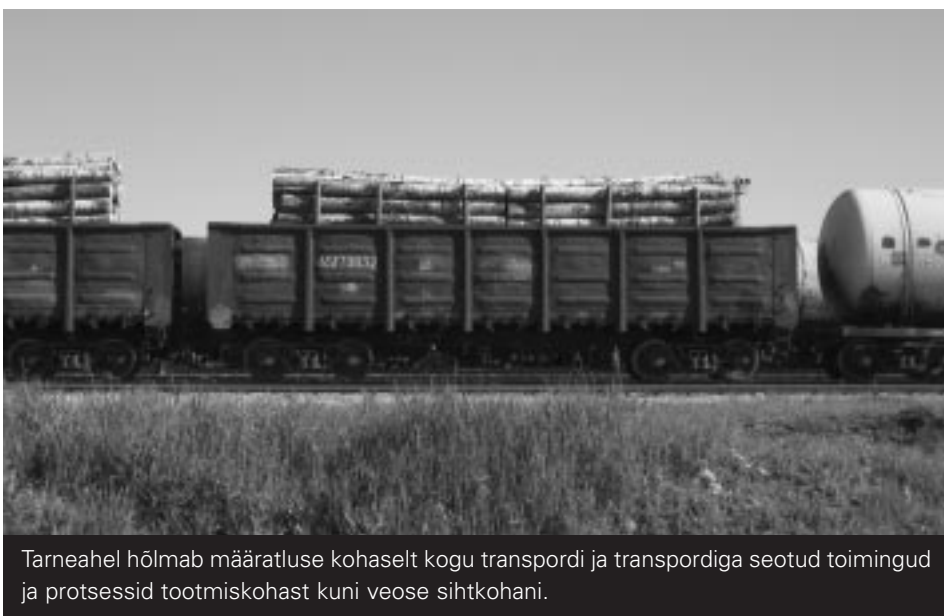
Tarneahel hõlmab määratluse kohaselt kogu transpordi ja transpordiga seotud toimingud ja protsessid tootmiskohast kuni veose sihtkohani.

Majanduspoliitika- ja õigusosakonna nõunik