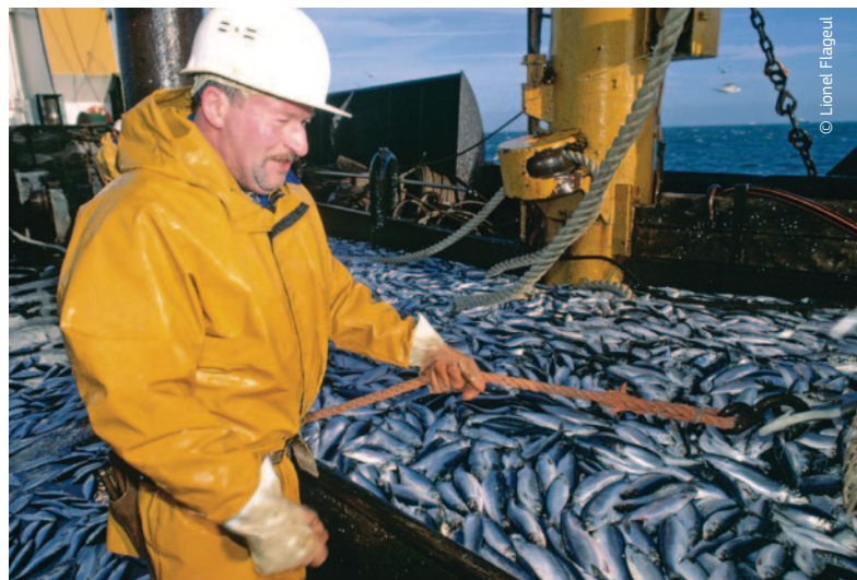
Mitmeaastased tegevuskavad on ajahambale vastu pidanud: enamik neist, mida on rakendatud Euroopa vetes alates 1997. aastast (nagu Põhjmere heeringa tegevuskava), on andnud häid tulemusi.

See jõustus 1997. aastal; kava vaadati üle ja seda uuendati 2004. aastal. Tegevuskava põhineb iga maksimaalset jätkusuutlikku saagikut tagava püügipiirkonna kalastussuremuse määral. Stabiilse kasutuse tagamiseks ei tohi lubatud kogupüük aastate arvestuses muutuda rohkem kui 15%. Tänu tegevuskavale suurenesid kalavarud vaid mõne aastaga taas üle ennetusliku taseme ja taastati säästva kalanduse põhimõtted. Teatud püügipiirkondadele, kes neid järgisid, anti säästva kalanduse märk.