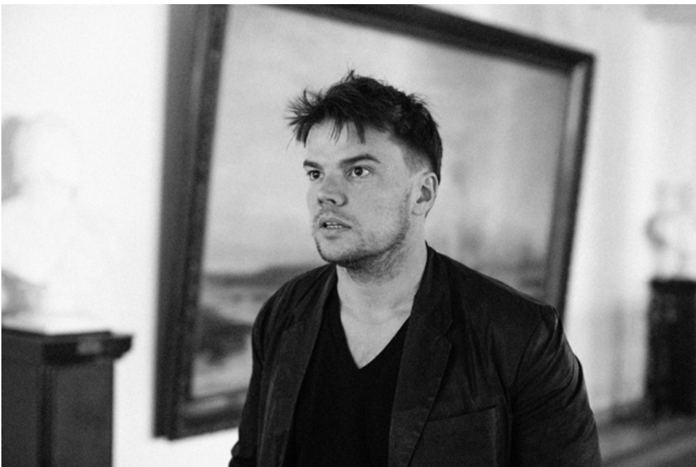
Staararhitekt Bjarke Ingels Tallinnas.