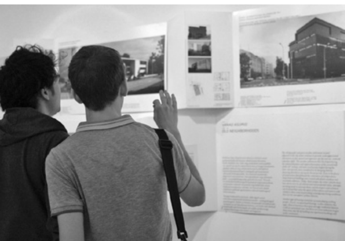
7. – 28. maini Budapesti arhitektuurikeskuses FUGA üleval olnud EALi näitus „Buum/Ruum. Uus Eesti arhitektuur”.