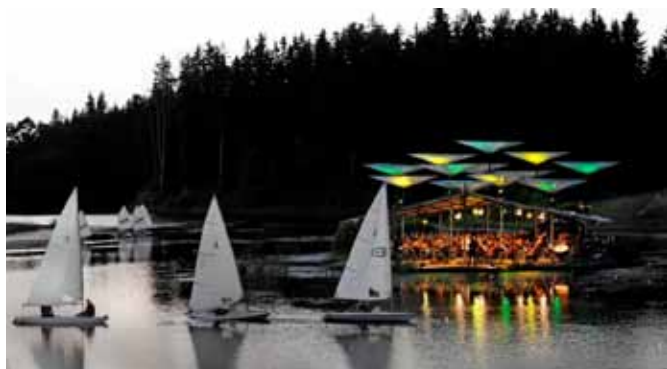
“Leigo järvemusika” klassikapäeva lõppkontsert kulmineerus Beethoveni 9. sümfoonia ja “Wellingtoni lahingu” vaatamängulise esitusega.