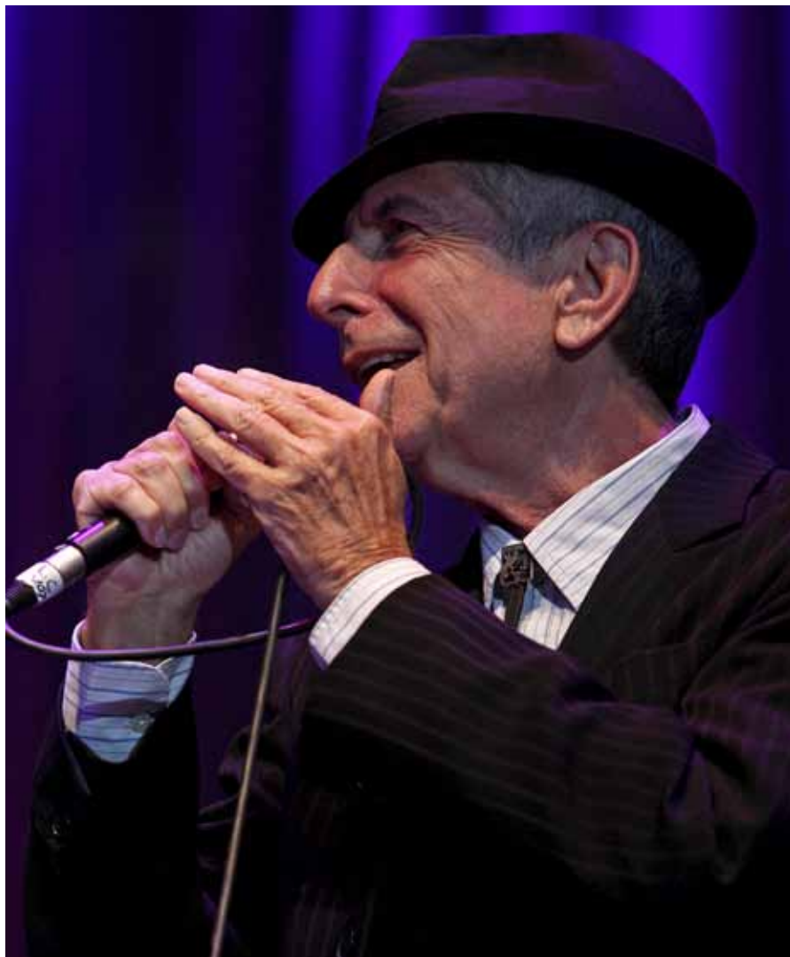
Leonard Cohen – nn popkultuuri maailma kogemata äraeksinud rabi.

Juulikuine Dublin, kus toimub koguni neli kontserti, võtab vastu ilmaga, milles vaheldub päeva jooksul vähemalt kolm aastaaega (lund küll ei tule, kuid kõik muud ilmastikunähtused on esindatud). Dublinlased on uhked oma uhiuue O2 kontserdimaja üle Liffey jõe ääres linnasüdamest veidi kaugemal. Ligi kolmveerand-tunnise kõndimise järel mööda jõekallast, kus ma ühinen järjest kasvavate inimvoogudega, rabab mind kaua oodatud hetkele imehästi sobiv sümboolika – vihmahoo möödudes ulatub vikerkaar jõest otse üle kontserdimaja otsekuvi meeldetuletus Jumala lepingust Noaga. Algus on seega paljutöotav, laulab ju Cohengi: “ I’m the little Jew who wrote the Bible ” (“Ma olen väike juut, kes kirjutas Piibli.”) Ümber maja on pikeerijad loosungitega: Leonard, palun ära laula Iisraelis! Nimelt lõpeb turnee Euroopa-osa Tel Avivis ning Cohen on vastanud protestijatele, et viimane kontsert on mõeldud lepitus- ja heategevuskontserdina