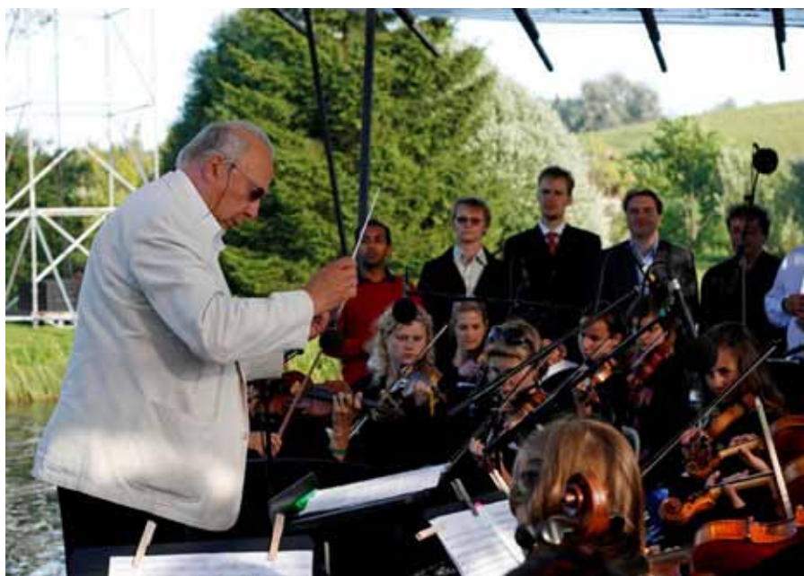
Neeme Järvi juhatamas lisapala Suveakadeemia lõppkontserdil, Üle-eestilise Noorte Sümfooniaorkestri liikmetest moodustatud kammerorkestri taga jälgivad maestro dirigeerimiskunsti Suveakadeemia õpilased.

Ent muusikaelu Lõuna-Eestis ei piirunud kesk augustikuud sugugi ainult “Leigo järvemuusikaga”, nagu publikule näida võis. Perekond Järvi, kes leidis tee Leigole juba eelmisel aastal, oli seegi kord kohal ja mitte üksnes esinemas. Neeme Järvi, kes tiheda töögraafiku kõrvalt igal aastal ka noorte dirigentide jaoks aega leiab, pidas tänavu vajalikuks kolida seni Pärnus Oistrahhi festivali ajal toimunud Järvi Suveakadeemia ümber Leigole ja Otepäele. 9.–16. augustini kestnud kursusel osales 12 dirigenti maailma erinevaist paigust, instrumendiks ÜENSO ja selle liikmetest moodustatud kammerorkester. Samal ajal toimusid Otepääl professor