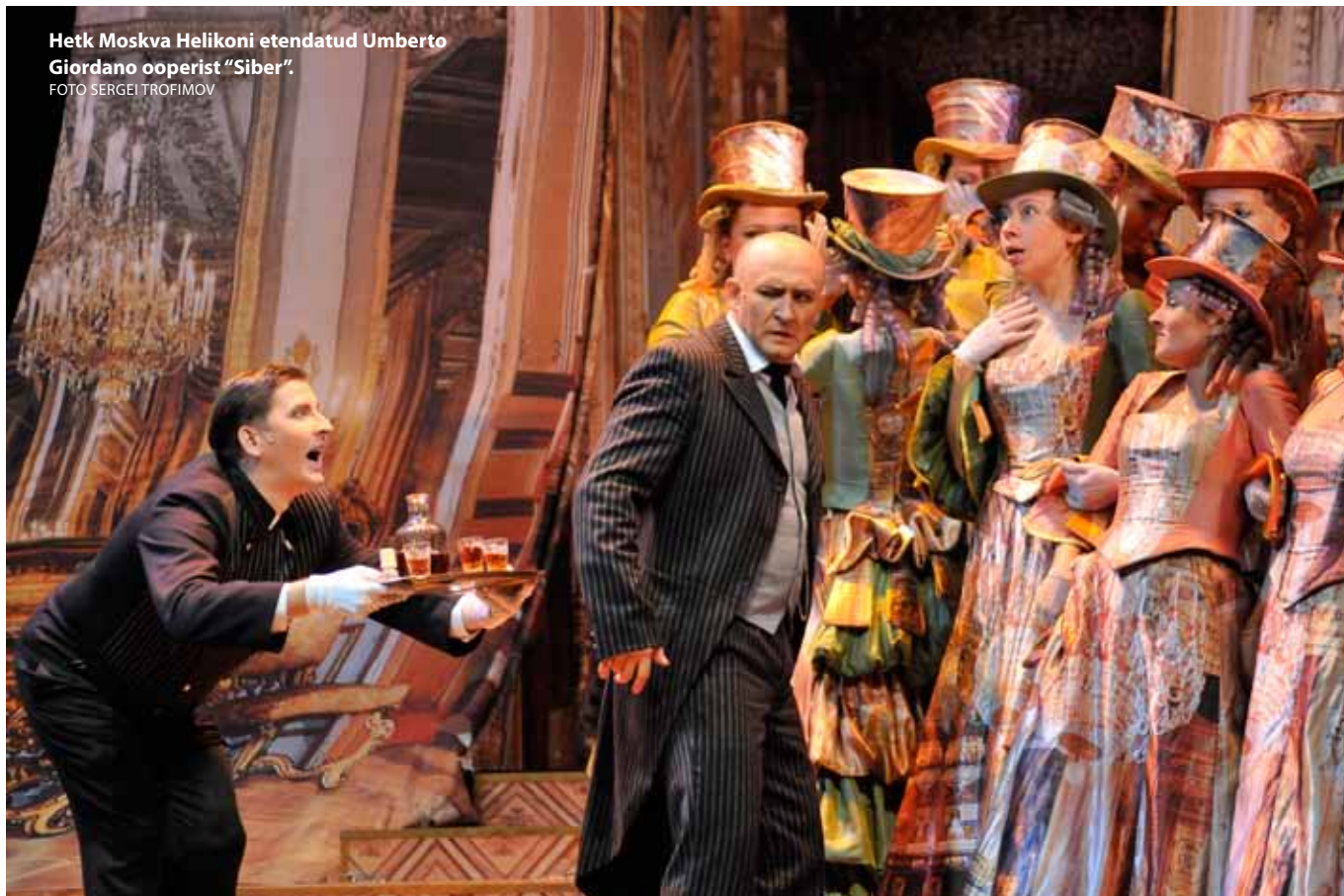
Hetk Moskva Helikoni etendatud Umberto Giordano ooperist "Siber".

gutes süttib ta ideedest kergesti ja paneb need ka kohe kirja. Praktika levimuusika vallas annab kindla käe vabadeks, inspiratsioonist sündinud leidudeks ja sama vabadusega pikib helilooja äratuntavaid motiive küll lavamuusika vallas, küll Orffist, isegi Dies irae kõlas justkui korraks... Ühekordne kuulamine ei anna selles tempokuses võimalust sümboolseid alltekste otsida-leida, aga oletada ju võib. Tauno Aintsi tugev külg on kõlataju. Ja hea kooride tunnetus. Üldse on tema muusika (pisut "vanamoodsalt?") kaunikõlaline ja valdavalt hea arendusega nii numbrite ulatuses kui ka kogu pika teose terviku mõttes. Leelo Tungla tekst oli avaldatud kavalehel ja, nagu stsenaarium, üksikasjadeni ette teada. Lavaline liikumine oli aga küllalt trafaretne, kulunud kujunditega ja täis mõttetuna tunduvat edasi-tagasi jooksmist. Või kandiski see kõik n-õ elulise sebumise mõttetuse mõtet? Täiesti arusaamatuks jäi, kus see lubatud tiik ikkagi oli. Ka etendusele järgneval (!) päeval ilmunud Sirbi esileht räägib veel ehtsast tiigist... Videopildi taust klooriseina krobrelisel