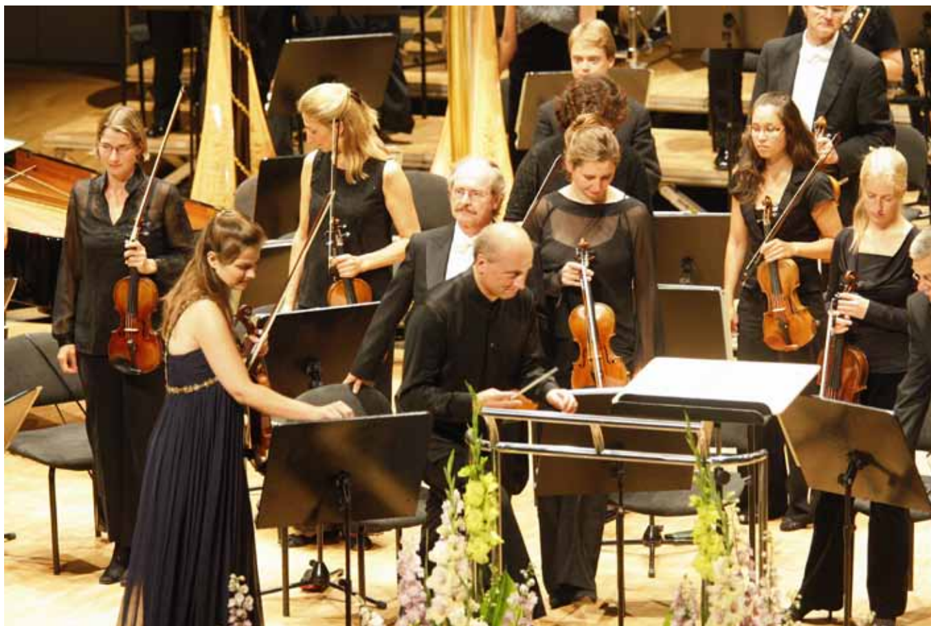
Paavo Järvi koos Janine Janseniga selle aasta augustikuus ERSO ees.