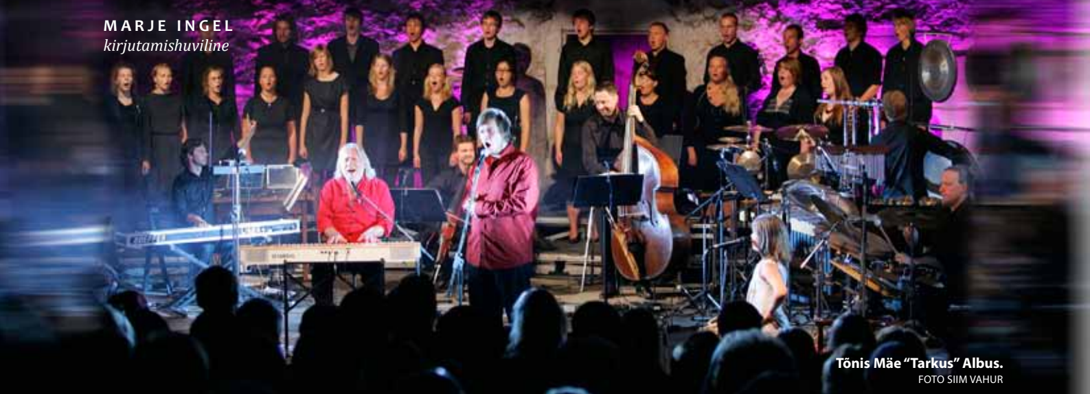
Tõnis Mäe "Tarkus" Albus.