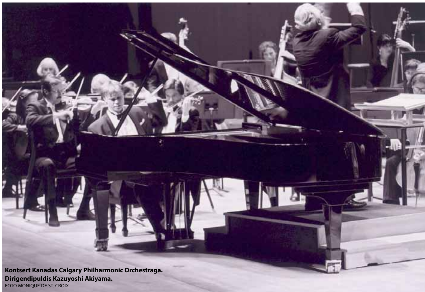
Kontsert Kanadas Calgary Philharmonic Orchestraga.