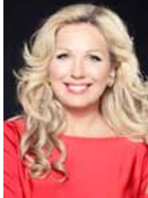
Annely Peebo

Tellimine: AS Express Post Maakri 23A, 10145 Tallinn Tel 617 7717, www.tellimine.ee Tellimisindeks 00679 Otsekorraldus 1,47 eurot number Aastatellimus 20,50 eurot Muusikaõpetajatele ja -õpilastele aastatellimuse soodushind 16 eurot. Soodushind kehtib ka pensionil olevatele muusikaõpetajatele. Tellimine: ia@ema.edu.ee, herje@ema.edu.ee, 6 416 016, 55 56 18 94