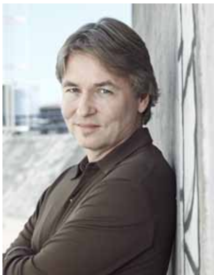
Tänavune Grawemeyeri auhinna võitja Esa-Pekka Salonen.