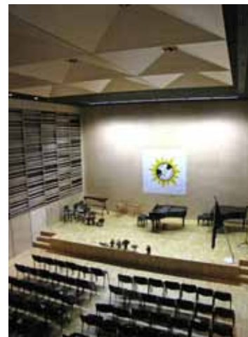
Keila Muusikakooli muljetavaldav uus saal.