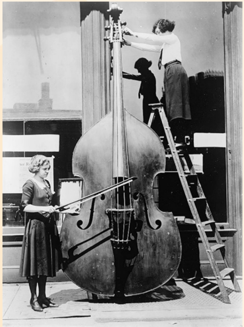
Erinevalt Vuillaume'i ehitatud octobass'ist, on sel Arizonas Phoenixi muusikainstrumentide muuseumis asuval hiidpillil koguni neli keelt.