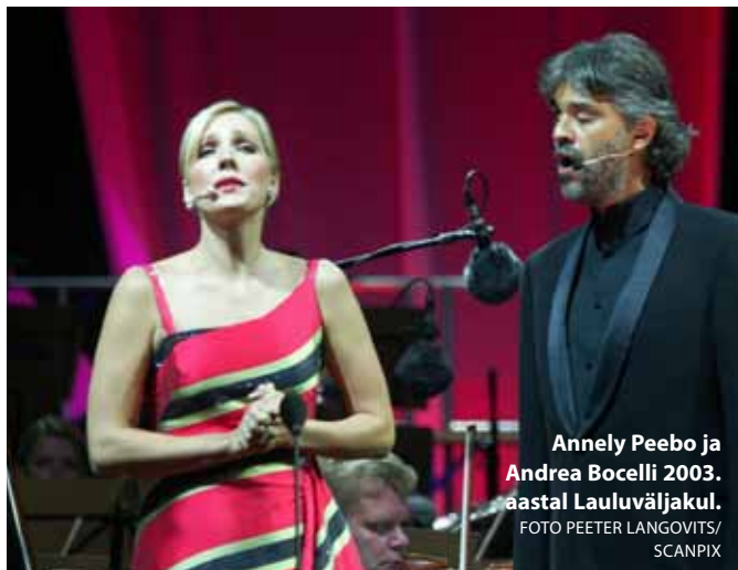
Annely Peebo ja Andrea Bocelli 2003. aastal Lauluväljakul.