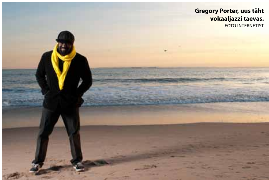
Gregory Porter, uus täht vokaaljazzi taevas.

Maailma mainekaim elektroonilisele tant-