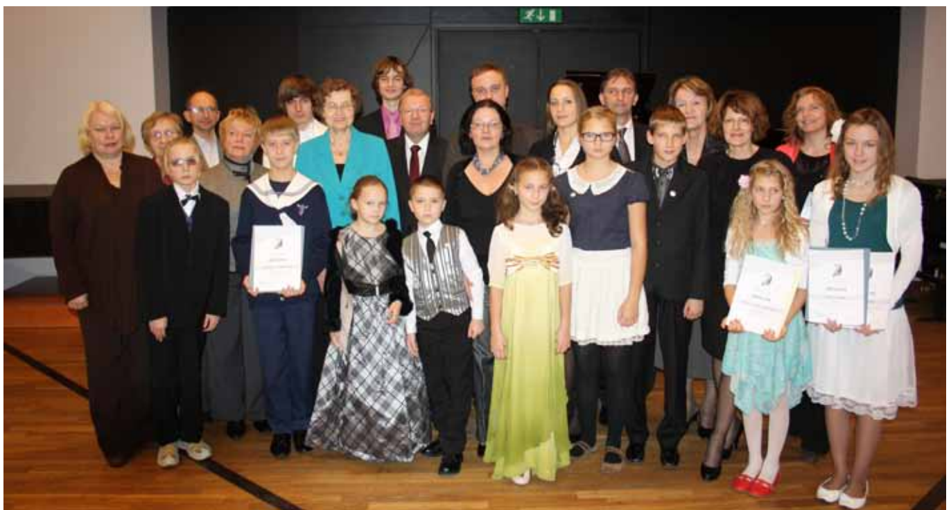
Noored pianistid oma õpetajatega.

Muusikalised eeldused tekiavad sellest, millises akustilises keskkonnas laps pikema eluperioodi vältel viibib.